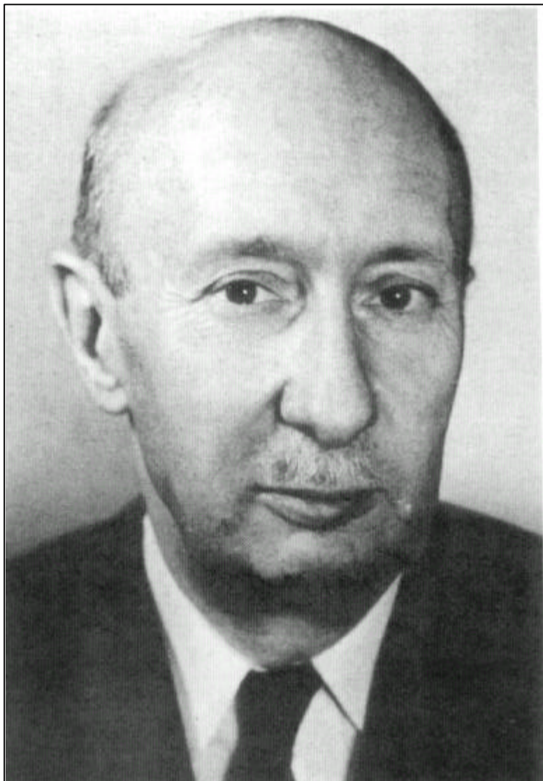
Békésy György 1899 – 1972