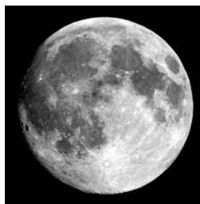
Sugársávok a Teleholdon

A déli pólusnál a Tycho, a nyugati részen a Copernicus és a Kepler kráterekből indulnak ki. A sávok a krátereket létrehozó meteoritok becsapódásakor keletkeztek, ahogy a kirepülő megolvadt anyag sugár irányban szétterült. Akkor lehet őket a legjobban megfigyelni, mikor a napsugarak nagyon nagy beesési szöggel érkeznek rájuk, azaz telehold idején.