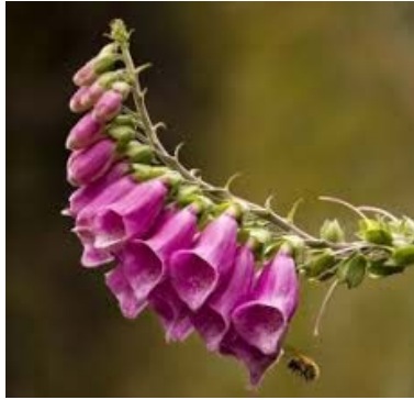
Piros gyűszűvirág barangvirágai