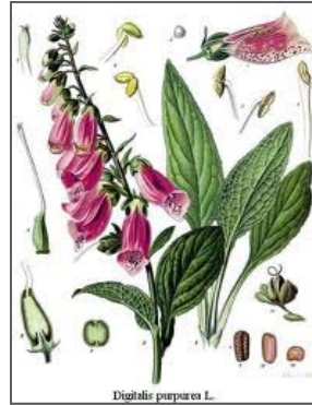
Piros gyűszűvirág felépítése

A Kárpát-medencében öt gyűszűvirágfaj fordul elő, mindegyik mérgező és egyben gyógynövény is. A piros gyűszűvirágon kívül ismertek még a gyapjas gyűszűvirág ( Digitalis lanata ), sárga gyűszűvirág ( Digitalis grandiflora ), kisvirágú gyűszűvirág ( Digitalis lutea ) és a rozsdás gyűszűvirág ( Digitalis ferruginea ). Gyógyászati szempontból a piros és gyapjas gyűszűvirág a legismertebb.