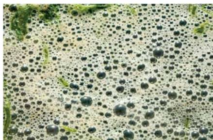
Metángáz képződése a mocsaras területeken

Újabb kutatások igazolják, hogy jelentős mennyiségű metán található az óceánok fenekén és jégbe fagyva a sarkvidékeken is.