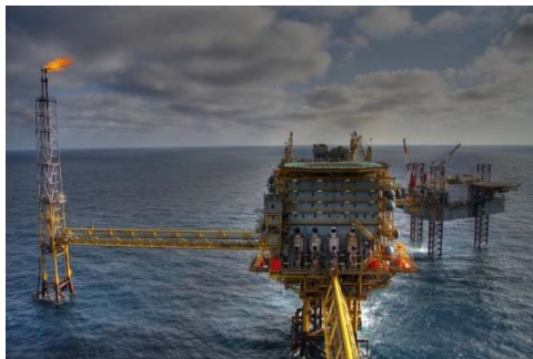
Földgáz kitermelés a Fekete-tengeren

Romániában 2022-ben megkezdődött a Fekete-tengeri földgázki-termelés, melyet a Black SEE Oil társaság és partnerei végeznek. A Midia földgázmező, melyet 2007-ben fedeztek fel, 120 km-re helyezkedik el a parttól.