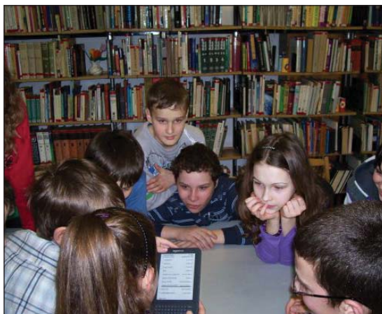
Szeretni fogjuk az e-könyveket? Szekszárd

Az Internet Fiesta médiamegjelenése széles körű volt. A reklámspot több tévécsa-