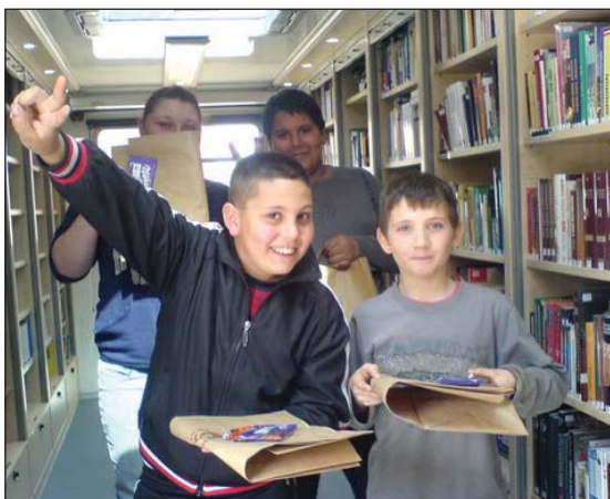
Győztesek a könyvtárbuszon. Cún

Az Informatikai és Könyvtári Szövetség 2011-ben is értékelte a könyvtárak fiestához kapcsolódó programszervező munkáját. Húsz könyvtár kapott elismerő oklevelet a rendezvények változatossága, ötletessége és újdonsága alapján.