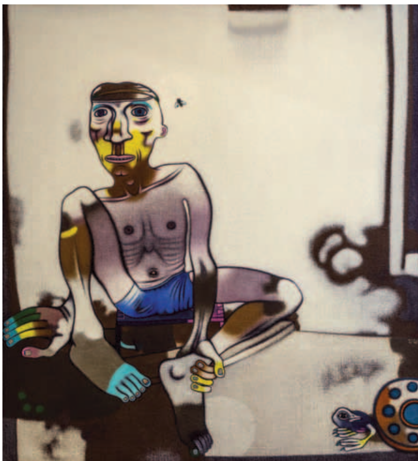
FÖLDI PÉTER, Kútbanézők, é. n.; Az itató helye (Meszeslábú a fal mögött), é. n.