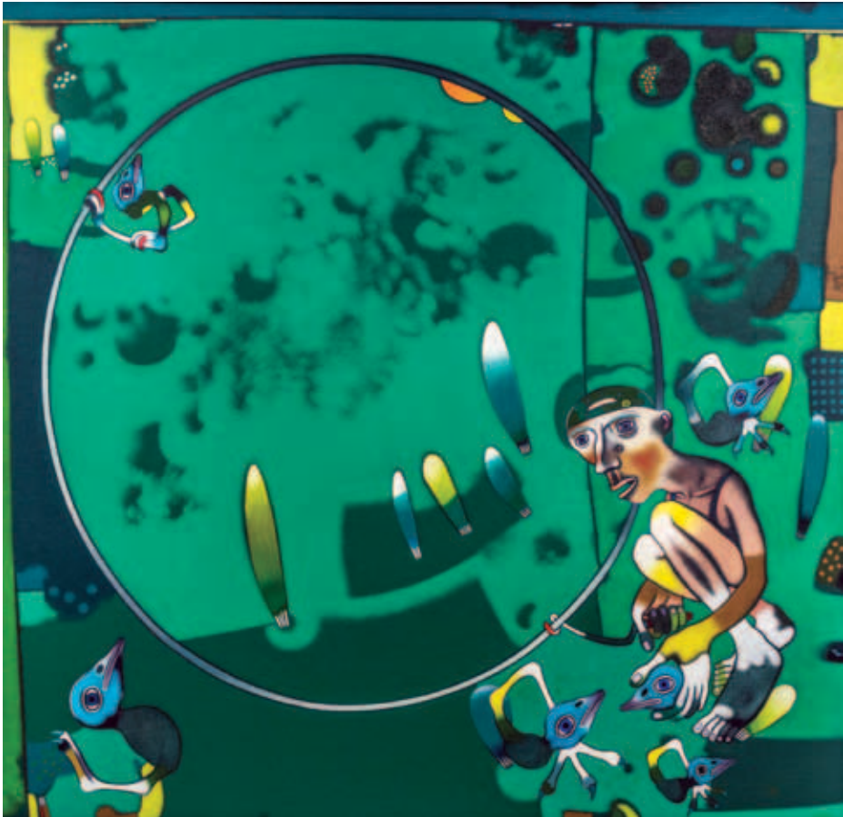
FÖLDI PÉTER, Földemlék (Harmadnapon), é. n.: A madarász fia karikázik, é. n.