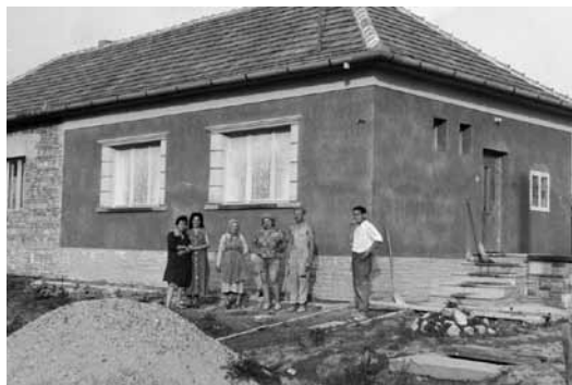
Különböző generációk a Kádár-kocka építésénél (1968).

A kockaházak legszembetűnőbb jellemzői a látszólagos egyformaságot megtörő, homlokzatokon látható egyedi ornamentikák, amelyek a kőporos vakolat festésével, tükrös és csempés díszekkel jöttek létre. A kőművesek a díszítősablonjaikkal kis túlzással olyan fontos szerepet tölthettek be, mint egykor a reneszánsz mesterek. Akárcsak a régiek, a kőművesek