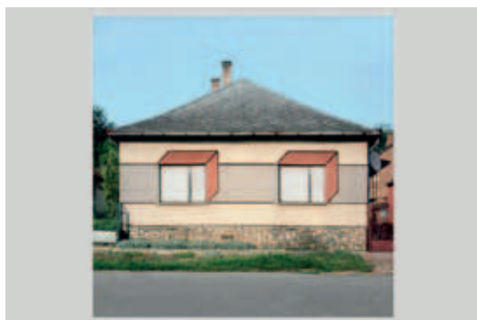
KATHARINA ROTERS, Hungarian Cubes, Székelyzabar (2008).