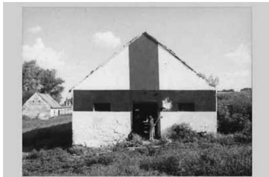
GYENIS TIBOR, Ilonka néni a tiszta formák geometriájával álmodott (1999).

A Kádár-kockák sokszínűségét bemutató eddigi legátfogóbb kortárs művészi projekt Katharina Roters és Szolnoki József nevéhez köthető. A német fotográfus és a magyar rendező, médiaművész