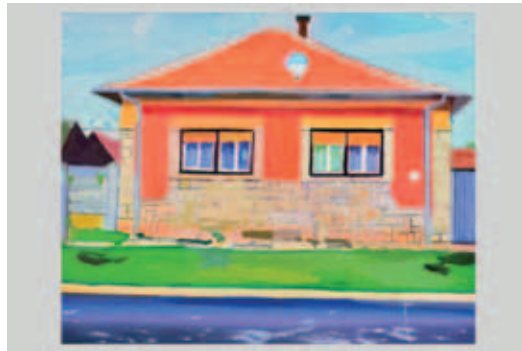
MERÉNYI DÁVID, Countryside Houses, Medgyesháza, (2021).

Merényi Dávid egyike azoknak a művészeknek, akik az építészeti és kulturális örökséget nem kizárólag a grandiózus műemlékekben látják meg. Azonos témára készült művei is színesek, változatosak, és ugyanúgy megtalálja az egyediséget az aluljárók vagy kapualjak felnagyított szegleteiben, mint a vidéki házak homlokzatában vagy udvarában. Utóbbiak olyan kortárs tájképek, amelyeken az utcák, az épületek ismerős, otthonos érzést keltenek a nézőben, és szinte elképzelhetjük az ott élőket. Merényi Countryside Houses című sorozatát 2022 márciusában mutatták be a Kelet Kávézó és Galériában, az alkotó így írt ekkor műveiről: „A valóság formai gazdagsága és sokszínűsége foglalkoztat, ami kife-