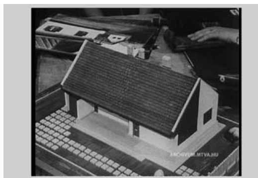
Részlet Zolnay Pál A ház című dokumentumfilmjéből (1975).

A házak megbecsülését jelzi, hogy ebben az időben indult útjára a ma már inkább csak a falvé-dők szövegéről ismert „ Tiszta udvar, rendes ház ” mozgalom. Az ötvenes években dr. Seres Géza kör-zeti orvos egyfajta népnevelő, közegészségügyi és köztisztasági céllal kezdeményezte olyan dicsőség-táblák kiosztását, amelyeket a legrendezettebb porták után kaphattak a lakók. Noha az értékelés elsősorban az előkert és a homlokzat megjelenése alapján történt (vagyis a házba nem mentek be az