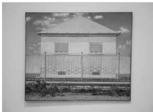
BIRKÁS ÁKOS, Új ház (1973).