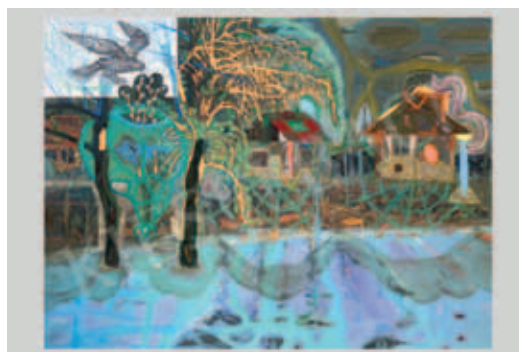
BUKTA IMRE, Az év madara (2012)