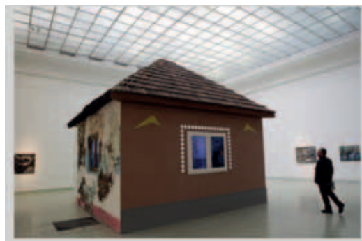
BUKTA IMRE, A ház (2012)

A magyar táj, a természet és az ember együttélése, a vidéki életmód, a növénytermesztés és az állattartás, valamint az ezekhez kapcsolódó hétköznapi helyek, tárgyak Bukta Imre művészetének fő elemei, amelyet ezért sokszor a mezőgazdasági szóval jellemeznek. A Mezőszeremén született és – kisebb szünetekkel – máig ott dolgozó művész számára autentikus környezetet jelent a falu világa, nem tanulmányozta vagy megtanulta, hogy milyen ott az élet, hanem maga is aktív tagja a közösségnek, és ez a fajta bensőséges közvetlenség látszik az alkotásain is. Érzékenyen mutatja be az ott élőket, finoman árnyalja lelki világukat, mindennapos tevékenységeiket, küzdelmeiket. Bukta a hagyományos