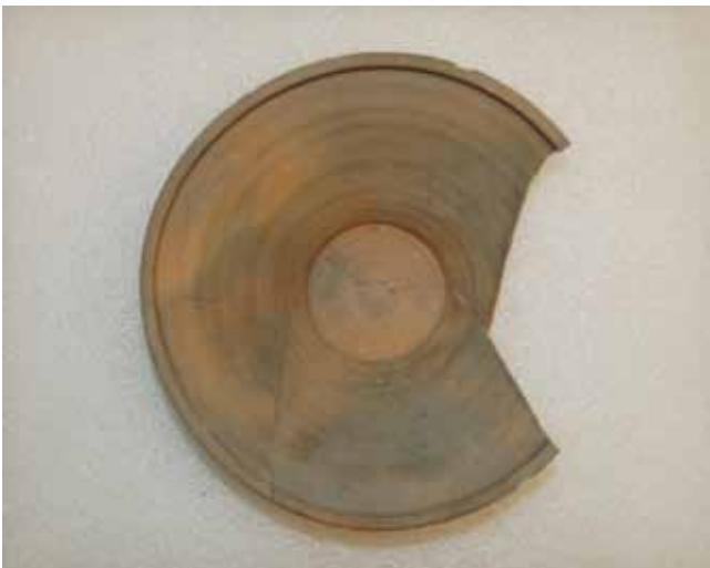
17. kép. Mázatlan cseréptál, átmérője 24, magassága 8,5 cm.