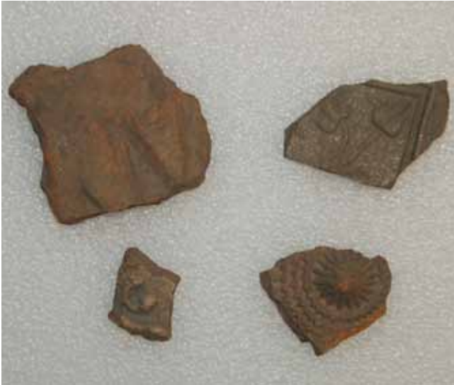
16. kép. Apró töredékek az anyagból.