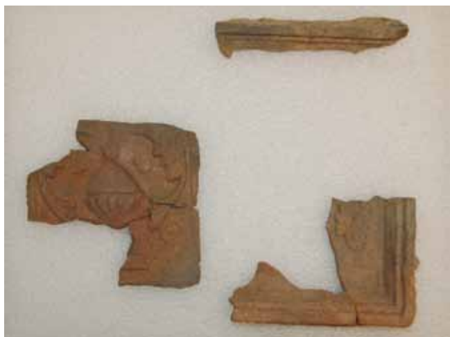
3. kép. Két másik csempe töredékei.