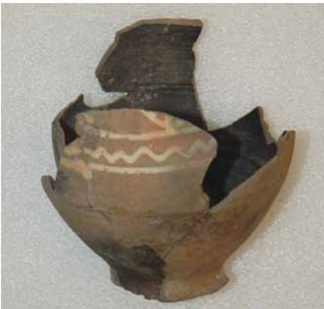
18. kép. Töredékekből összeragasztott korsó.

A különböző állati csontok és a csempék hátából kiesett agyagdarabok mellett a leletanyagban még van néhány nehezen értékelhető apró töredék (16. kép). Hosszas kutatómunka eredményeként bizonyára ezeknek is megkerül majd a helyük.