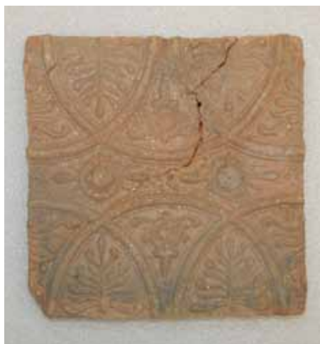
6. kép. Brokátmintás mezőcsempe, 23,5x23,5 cm.