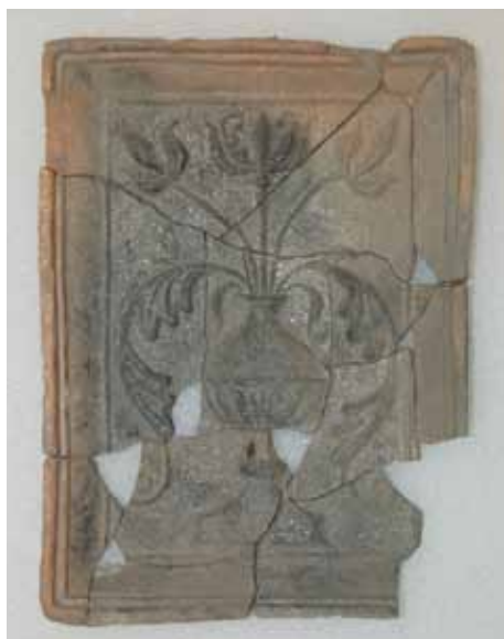
2. kép. Olaszkorsós- tulipános csempe, 26x19,5 cm.