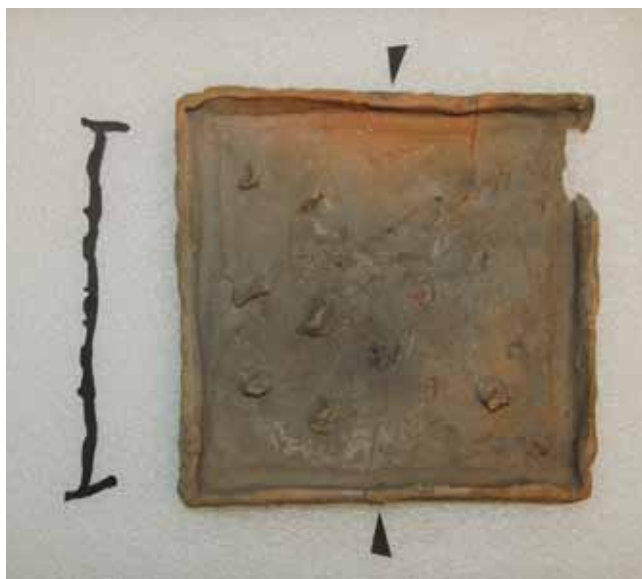
5. kép. „Cserelapis” csempe hátoldala és metszete.