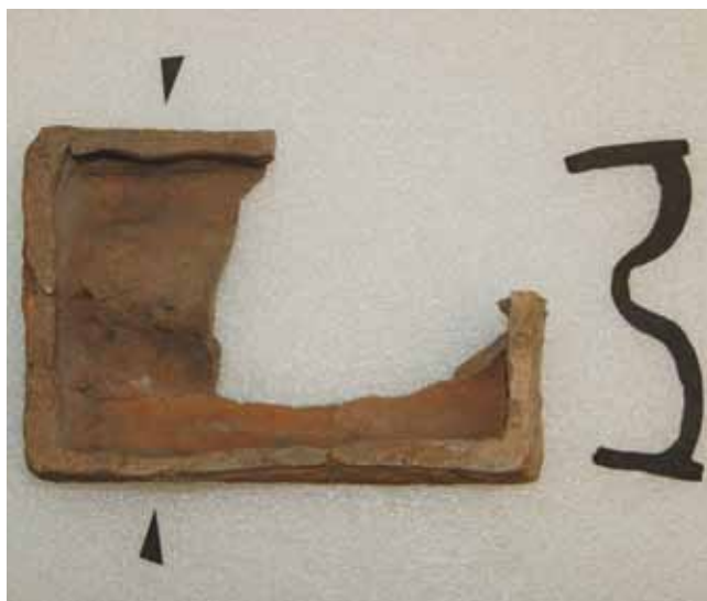
13. kép. Párkányelem hátoldala és metszete.