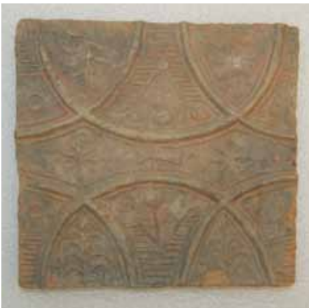
8. kép. Brokátmintás „keresztes” mezőcsempe, 23x22 cm.