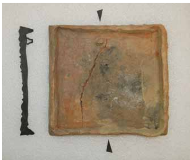
11 kép. Brokátmintás „szemdiszes” csempe hátoldala és metszete.