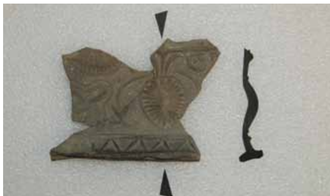
14. kép. Rovátkált kazettás csempetöredék, 14x10 cm.

a csempelapnak, hogy valószínűleg már nyers állapotában, száradás közben elrepedt, mivel a törés két szélé összeér, de közepén a szélek eltávolodtak, mégis beépítették a kályhába. Valószínűleg 17. századi csempe, származási helye ismeretlen. Dana Marcu ehhez hasonló töredékek sematikus rajzát közli Alsórákosról, de úgy tűnik, nem egyeznek ezekkel. 5