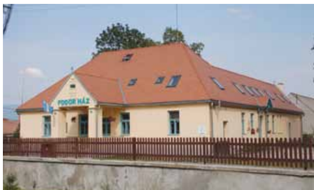
1. kép. Fodor-ház, Csíksomlyó.

Csíksomlyón, a nagytemplom felett, a pálfalvi leágazásnál áll az úgynevezett Fodor-ház (1. kép), melynek utolsó, jelesebb tulajdonosa a Fodor család volt, innen kapta a nevét is. A terület már nagyon régen lakott volt, ezt tanúsítják a ház fölötti részen több ízben végzett leletmentő ásatások. Ezek során a Csíki Székely Múzeum munkatársai számos kezdetleges cölöpház nyomára bu-