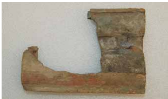
12. kép. Párkányelem, 23x16 cm.