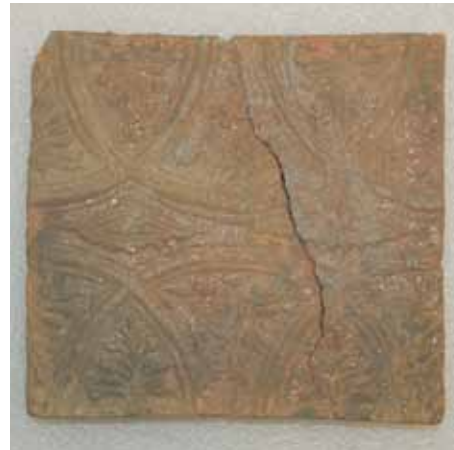
10. kép. Brokátmintás „szemdíszes” mezőcsempe, 22x21 cm.

A brokátmintás csempe a 17. századtól kezdve nagyon kedvelt volt, Erdélyszerte, sok változata került elő. Úgy vonult be a köztudatba, mint brokátmintás habán csempe, mivel a habánok műhelyeiben készültek az első példányok, majd ezután terjedtek el egész Erdélyben. Jellemzőjük, hogy az egymás mellé helyezett csempelapok köríves mintázata a kályhán egész köröket eredményez. A korai darabok többnyire mázatlanok voltak és csillámozott agyagból készültek, de számtalan zöldmázás csempét is találunk közöttük.