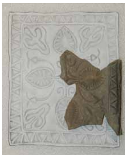
15. kép. Kazettás töredék alapján készült rekonstrukciós rajz. Becsült mérete 23x19 cm.