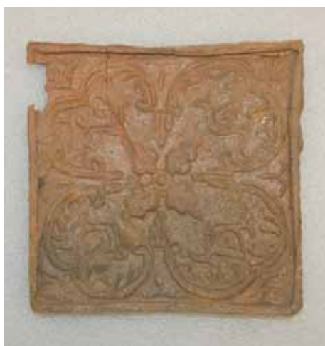
4. kép. „Cserela- pis” csempe, 22,5x22,5 cm.