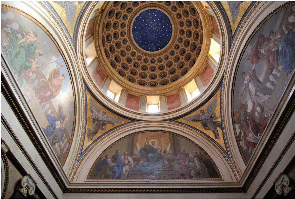
1. kép. A Deák-mauzóleum lunettamozaikjai. 1903. Székely Bertalan elpusztult freskói után készítette Róth Miksa és műhelye. Fiumei úti Sírkert, Budapest.