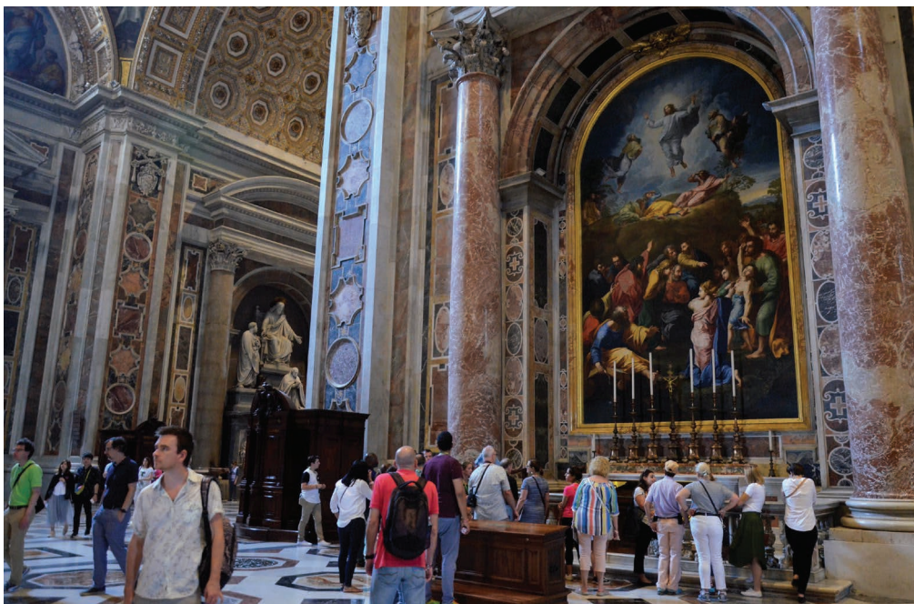
4. kép. Több mint 10000 négyzetméter mozaik díszíti a római Szent Péter Bazilika belseit. Nemcsak a kupolák és boltozatok díszítményeit, de az összes oltárképet is mozaiktechnikájú másolatok helyettesítik.