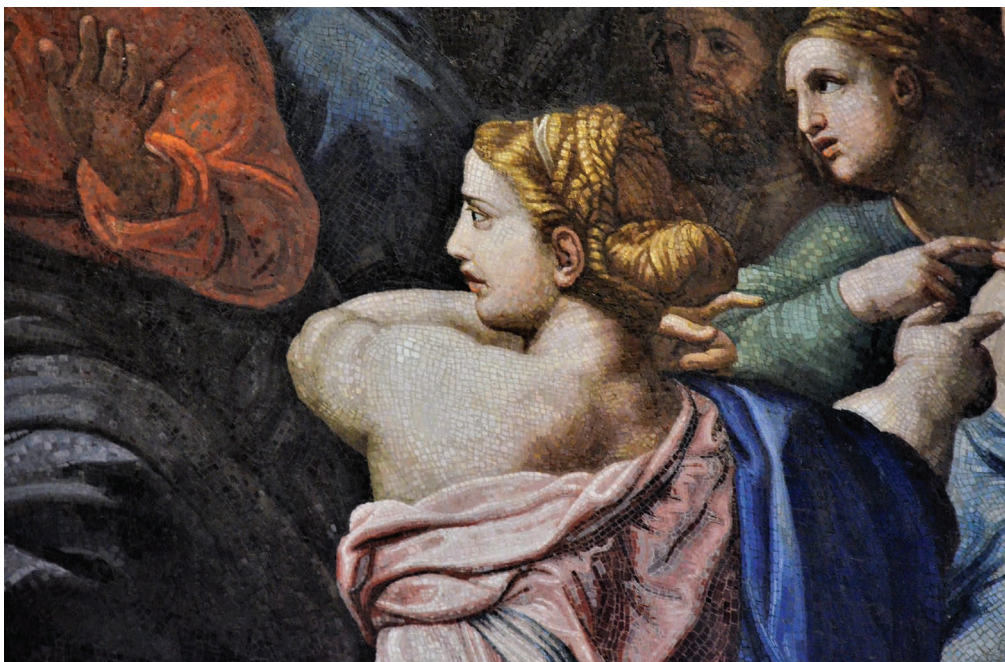
5. kép. Részlet Raffaello Santi Krisztus színeváltozása című festménye után készült mozaikmásolatról (1756-67). Szent Péter Bazilika, Róma, Vatikán.