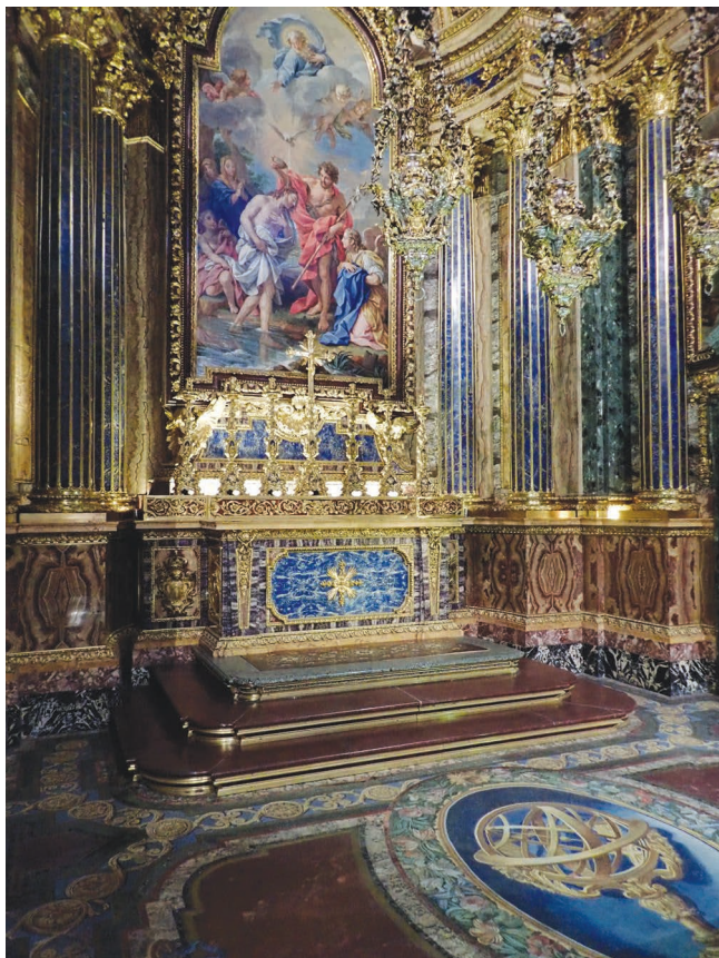
6. kép. A Keresztelő Szent Jánosnak szentelt „mozaikkápolna” a lisszaboni Szent Rókus templomban

Miután a kupolák díszítése befejeződött, 1700-tól kezdődően a bazilika oltárképeinek mozaik reprodukciói készültek. A szükséges színek széles választékának előállításához 1731-ben épült üvegműhely közvetlenül a Vatikánban. 1727-ben XIII. Benedek pápa 19 állandósította az intézményt Vatikáni Mozaik Stúdió néven. 1742 és 1747 között készült el Rómában az V. János portugál király számára megrendelt Keresztelő Szent János kápolna együttese, melyet a Lisszabonba való szállítása után építettek össze a Szent Rókus templomban. A „mozaikkápolna” a drágakő intarziák, az aranyozott, ezüstözött díszítmények, valamint az asztrolábiumot ábrázoló padlómozaik mellett három oltárképet is magába foglal, melyek már a megrendelés és tervezés alapján is mozaik technikájú képekként szerepeltek. Az Agostino Masucci által megfestett olajképek szerepe ebben az esetben alárendelt a Mattia Moretti mozaikművész által készített mozaik technikájú oltárképek elkészítéséhez. Az olajfestményekről másolat is készült; az eredetit Lisszabonba küldték, hogy reprezentálja a leendő kompozíciót, a másolatot a mozaikművész kapta munkáját segítő kartonként. 20 1775-ben Giacomo Raffa-