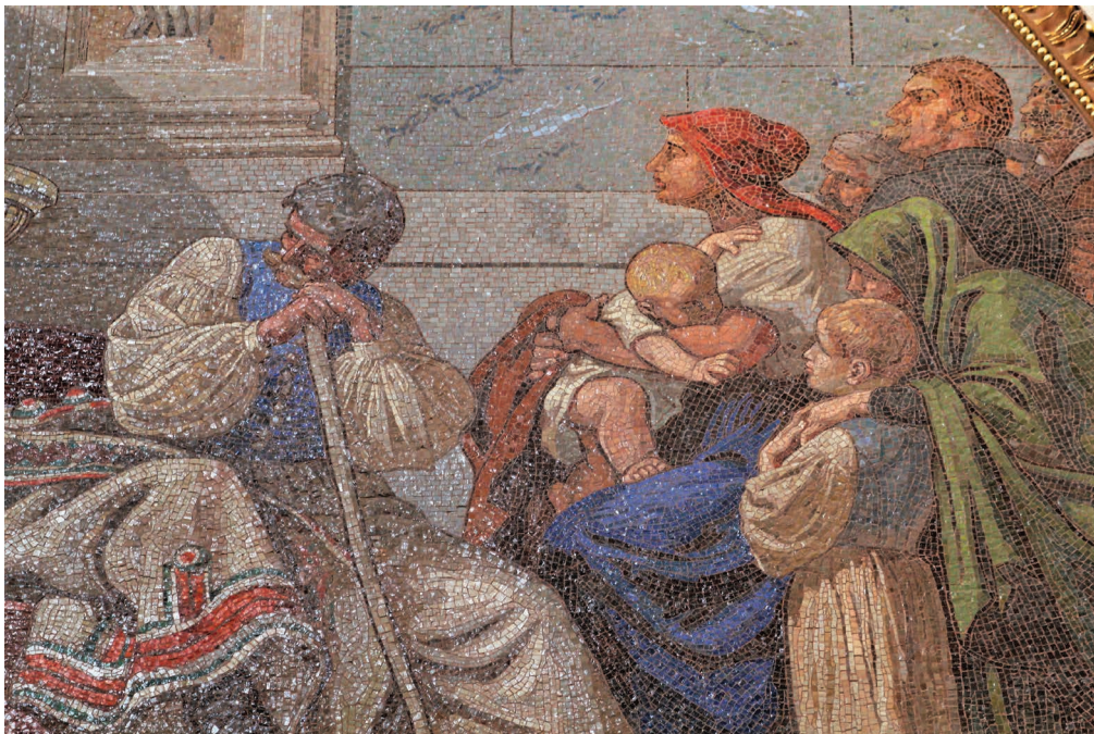
2. kép. Részlet Székely Bertalan elpusztult freskóinak vázlatai alapján készült mozaikból. 1903. Deák-mauzóleum, Fiumei úti Sírkert, Budapest (a szerző felvétele).

nyomán. A domborművet először kőből tervezték megfagragtatni, majd a módosított tervek alapján végül ólomból készült el. 13 Az eredetileg kéttornyúra tervezett épülethez végül egy torony épült fel. A fennmaradt tervek is kezdetben két részből álltak, majd, igazodva az építészeti kialakításhoz, egy frízszerű kompozícióként ábrázolták „Pannonhalma kettős alapítását”. Az 1831-ben felhelyezett dombormű egy 1877-ből fennmaradt feljegyzés tanúsága szerint nem állt jól ellen az időjárás viszontagságainak,