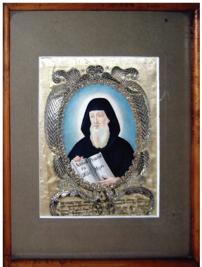
30. kép. Szent Benedek. Festett, hímzett, apácamunka.