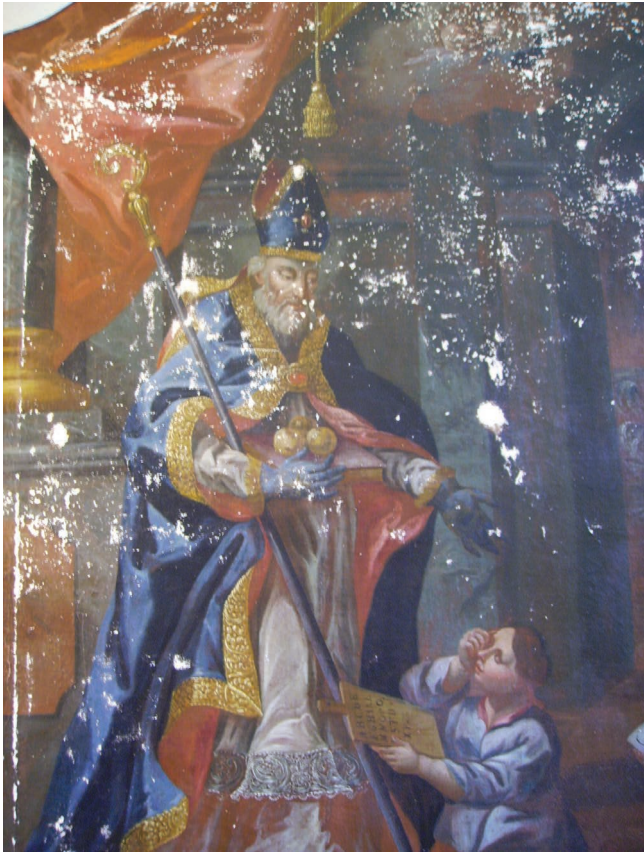
31. kép. A Szent Miklóst ábrázoló festmény tömítés közben, részlet.

Az egyházművészeti gyűjtemény megalapításánál, figyelembe véve az ide vonatkozó pápai irányzatokat is, célul tűztük ki kulturális értékeink megőrzését, gondozását 31 , valamint ezen keresztül tárgyi örökségünk megismertetését, bemutatását, ami egyben a felekezeti és kulturális identitásunk megőrzését is szolgálja. A jövőben is gazdagítani és gyarapítani szeretnénk a már meglévő gyűjteményt, örökségül hagyva az utókor számára, hogy a tárgyakon keresztül bepillantassanak az elmúlt korok e térségeiben élt embereinek életébe.