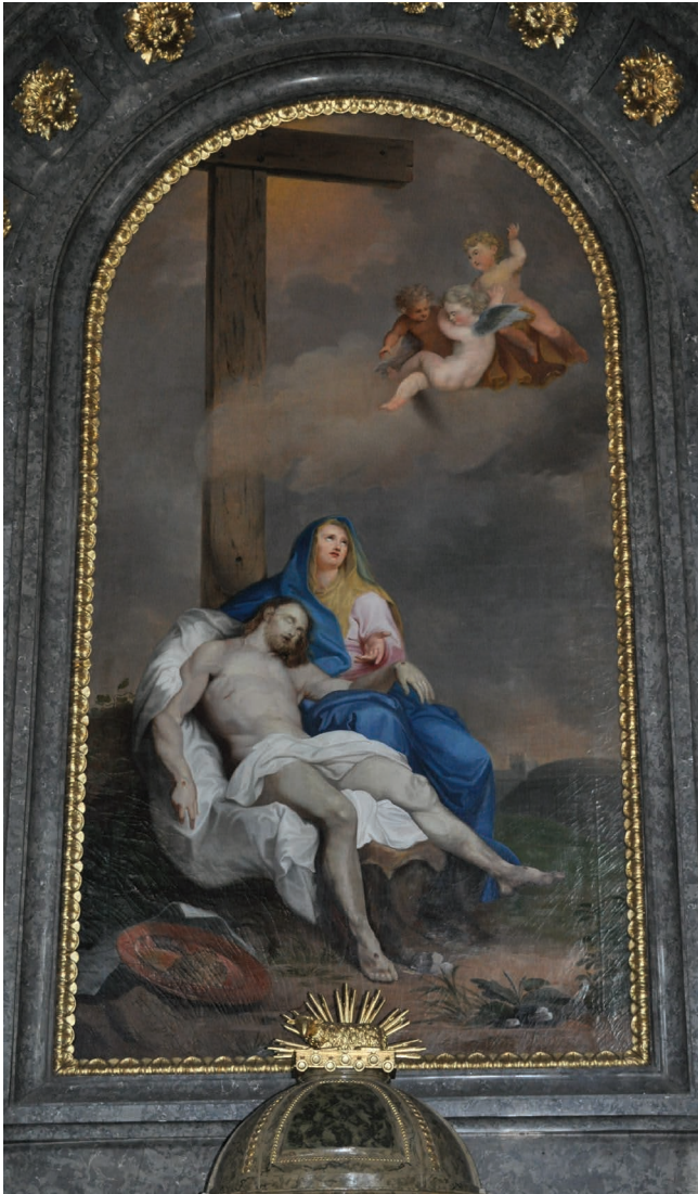
21. kép. A restaurált Pietá oltárkép.