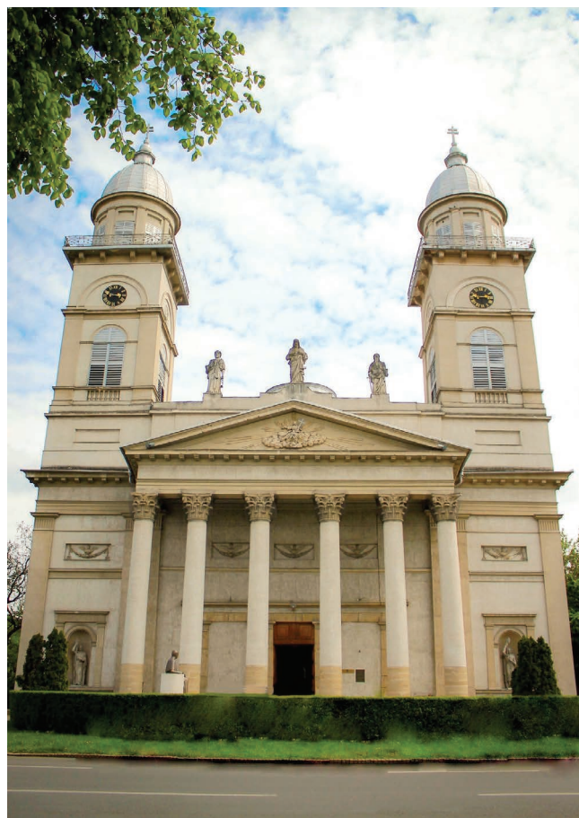
1. kép. A Szatmárnémeti Székesegyház.

Amikor 1804-ben e térség levált az egri egyházmegye területéről és létrejött a szatmári egyházmegye, a templom szűkösnek bizonyult és elkezdődött a megnagyobbítása, székesegyházzá való átalakítása. Az első munkálatok báró Fischer István (1804-1807) püspöksége idején kezdődtek, amelyet Klobusiczky Péter püspök folytat (1807-1821) és Hám János püspök fejez be az 1830-1837-es időszakban. A kupola, a mellékhajók, a portálé és a két torony Hám idejében készültek el, feltehetően Hild József budapesti