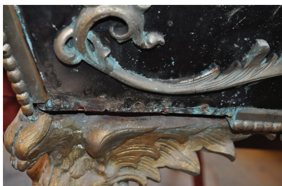
14a-b. kép. A koporsó belső oldala restaurálás előtt és külső oldala restaurálás közben, részletek.