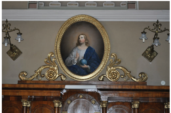
4. kép. Pesky József: Salvator Mundi.