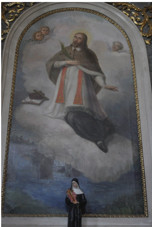
11. kép. A Nepomuki Szent János oltár.