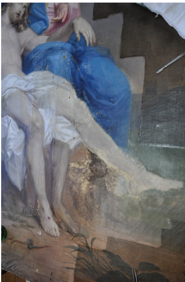
19. kép. Pietá, részletfotó restaurálás közben.