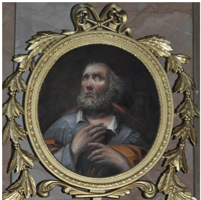
10. kép. A Szent Péter kép restaurálás után.