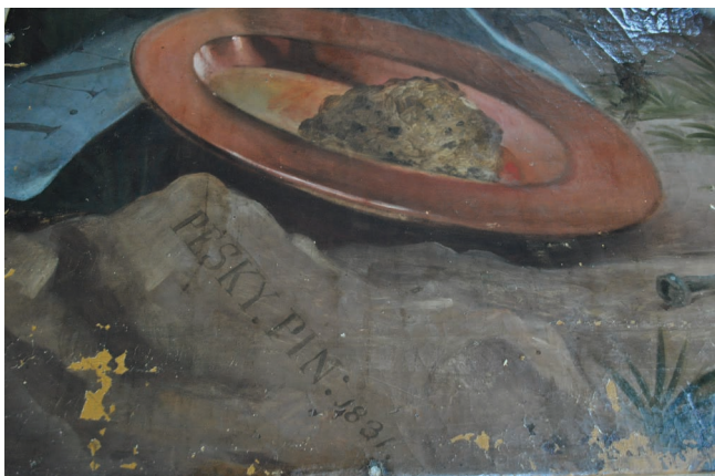
18. kép. Pietá, részletfotó feltárás közben.