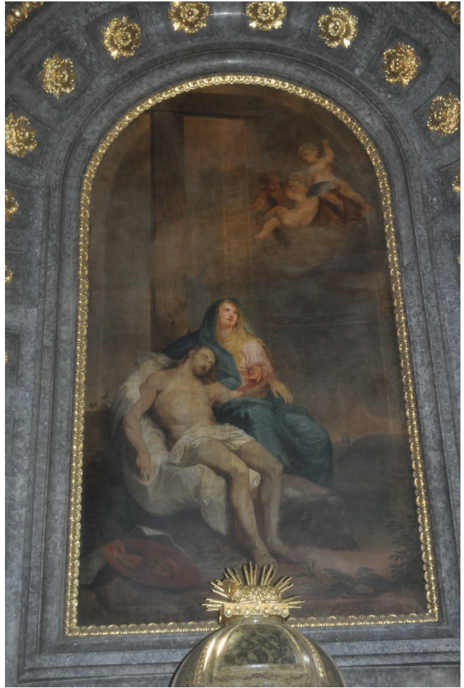
17. kép. Pesky József: Pietá. Az oltárkép restaurálás előtt.

A fedélszerkezet Meszlényi püspöksége alatt újul meg, amikor a kupolát és az egész fedelet vörös rézlemezzel fedték be, lecserélve a már elöregedett, korhadt zsindeletet. Az ehhez szükséges 4212 tábla vörösréz lemezt a borostyánkői rézhámor szállította. Az első világháború idején, 1917-ben rekvirálták a rézfedelet, majd cserébe palával és bádoggal fedték be a tetőzetet. 12