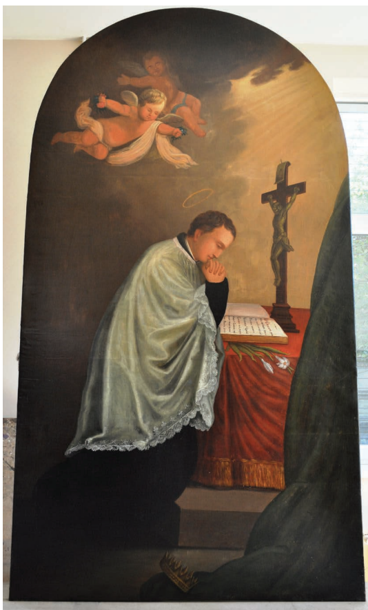
12. kép. A Gonzaga Szent Alajos oltárkép restaurálás után.