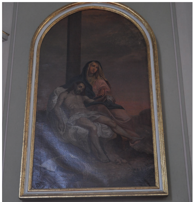
23. kép. Mezey József (1856): Pietá. Csomaközi plébániatemplom.