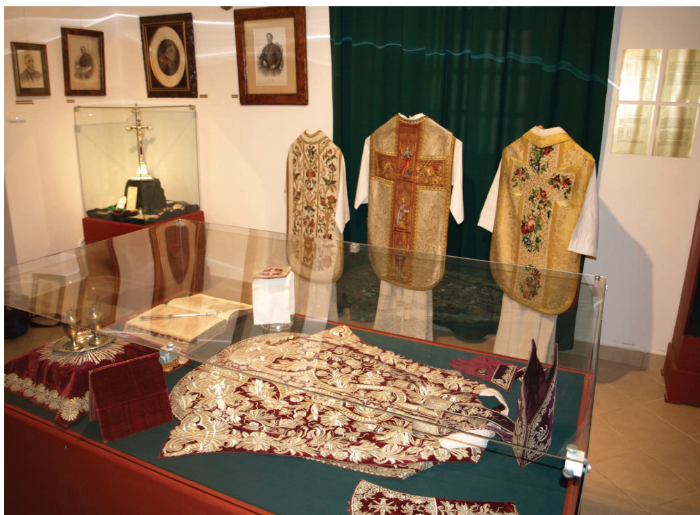
24. kép. A kiállítás első terme.