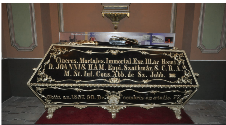
15. kép. A restaurált koporsó a kápolnában.