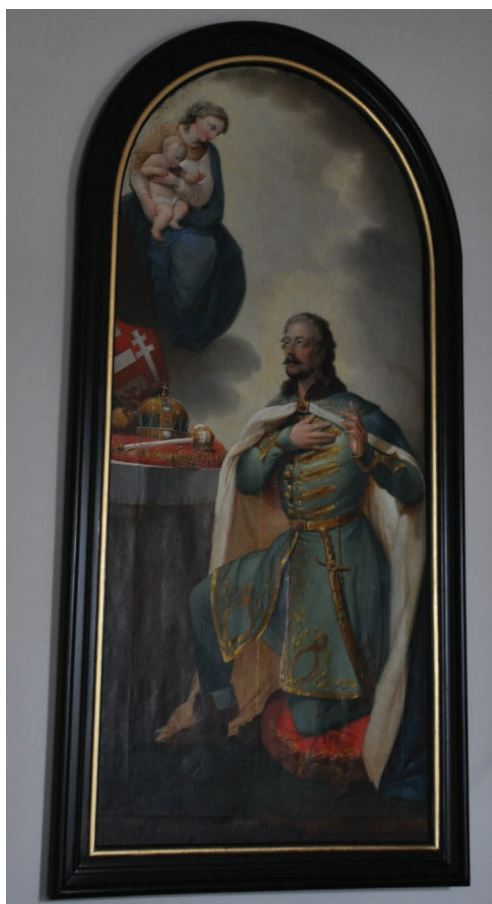
6. kép. Pesky József: Szent István.