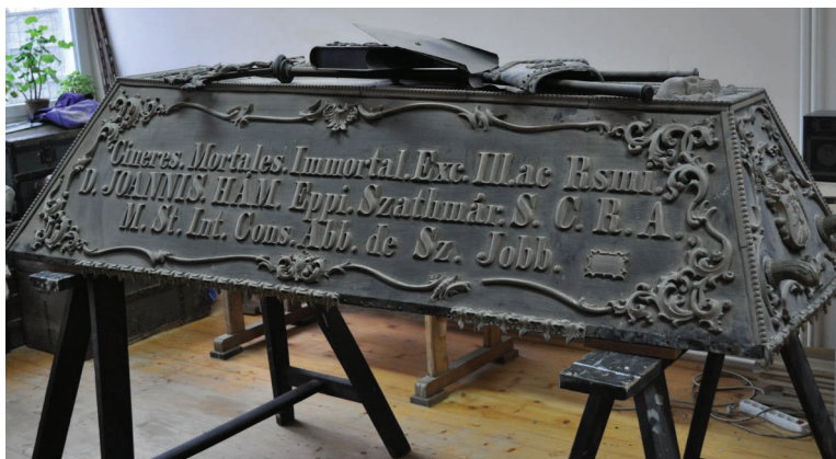
13. kép. Hám János koporsójának fedele restaurálás előtt.