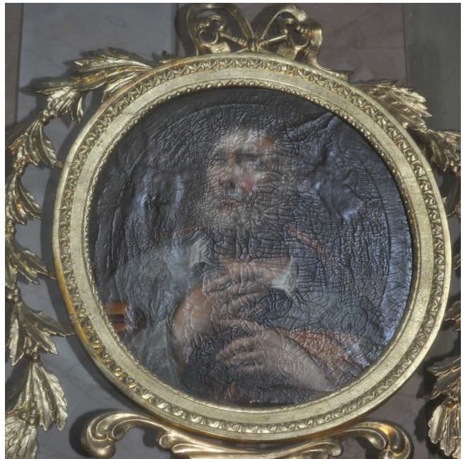
8. kép. A Szent Péter kép restaurálás előtt.