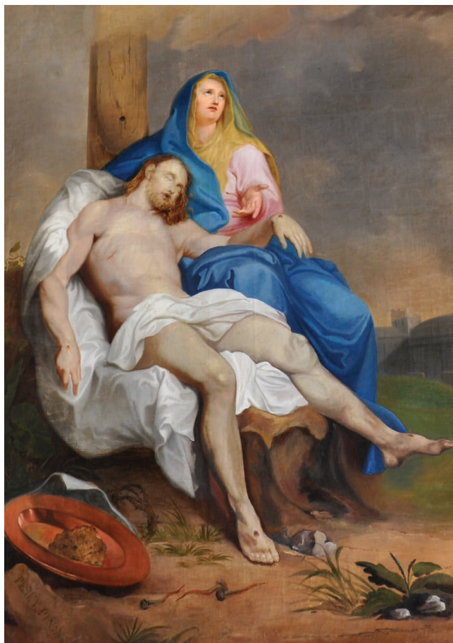
20. kép. Pietá, részletfotó restaurálás után.