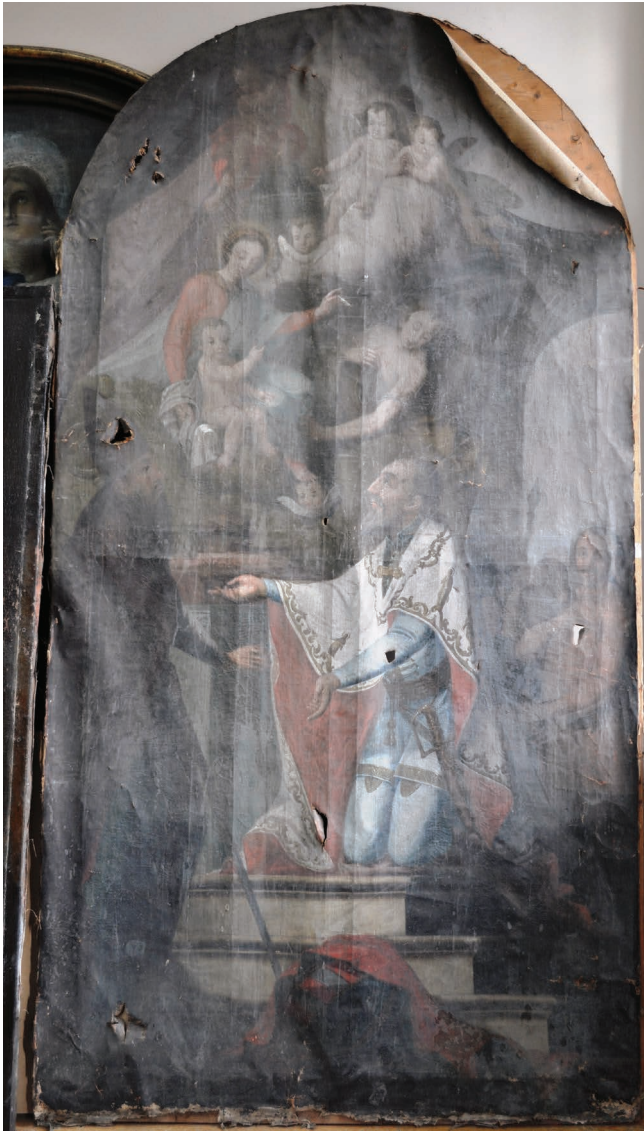
2. kép. A régi plébániatemplom Szent István oltárképe.