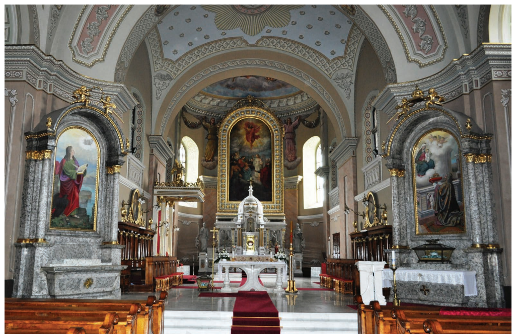
5. kép. A szentély valamint a Szent István és Evangélista Szent János oltárok napjainkban.