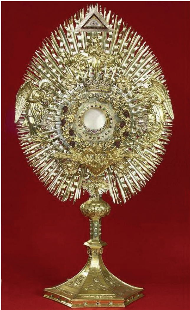
28. kép. Aranyozott ezüst monstrancia, I. Kern műhelye, Bécs, 1837.

kotások megmenekültek a pusztulástól, és restaurálásuk után a kiállítás díszei lettek. A Pásztorok imádása és a Királyok imádása két barokk festményen kívül többek között bemutatunk egy Carl Blaas által szignált Szent Péter tanulmányfejet, egy rézlemezre festett szent Jeromos képet és egy, Jusepe de Ribera hangulatát idéző Szent Bertalan mártíromsága című alkotást. Ma már itt látható az egykor a Püspöki Palota kápolnáját díszítő, Mezey József által 1855-ben festett Immaculata Conceptio, szeplőtelen fogantatás című festmény, valamint egy Szent Miklóst ábrázoló kép is (31-32. kép). 30