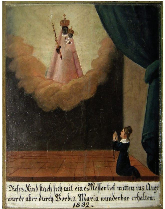
29. kép. Hálaadókép, 1832.