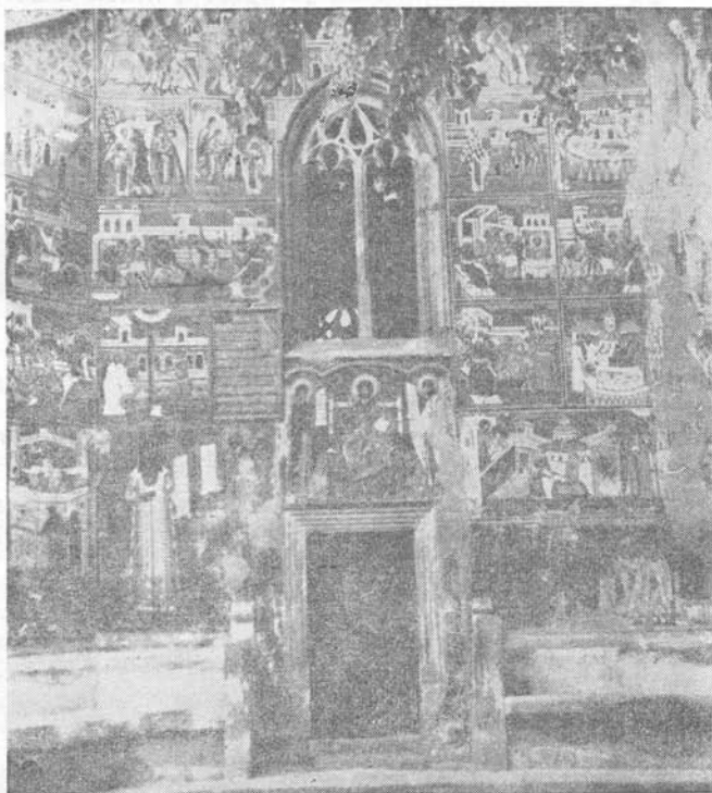
A voroneji kolostor bejárati oldala

Túlzott szubjektívitásommal magyarázom, hogy Moldva egy asszony alakjában él bennem. Ő nekem az ősi, e földben gyökerező „anyóka, édes, gyapjúkötényes” — e tájak szellemiségének gyümölcse; hullámzó térben száguld, távolbavesző, képzeletbeli kolompszó-kisérettel. Iszonyatos büntettek nyomát követi, mely az ifjú és a „világszép mátká, tündérkirálylány” jegyességével: a halállal végződik. Fájdalmában az öregasszony maga elé képzeletben a furcsa házasságkötést, melyben a vőfély és a nász-nép a Nap meg a Hold — mint személyek; fenyők meg juharfák káprázatos tömege kíséri őket, s csillag a fáklya ebben az örökre szóló, különös házasságban.