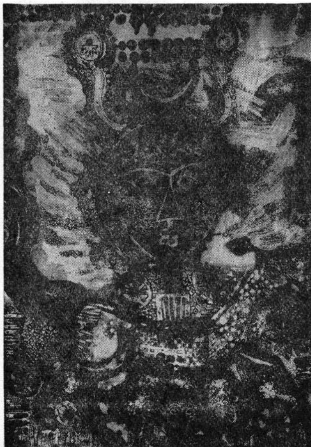
Kópacz Mária Cirkusz