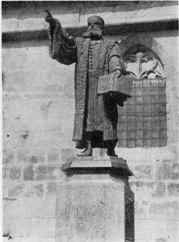
Johannes Honterus szobra (a brassói Fekete-templom oldalán)