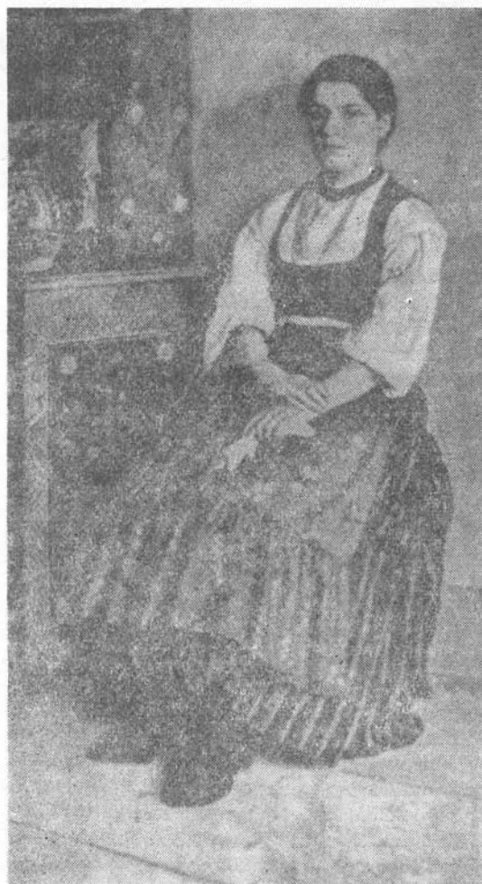
Artur Coulin: Álmodozás (Szekely lány falusi szobában)