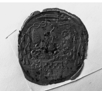
Tusnádi Kováts Miklós püspök viaszpecsétje (1850)