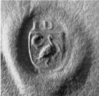
Szárhegyi Fülöp János Deák felzetes pecsétje (1641)