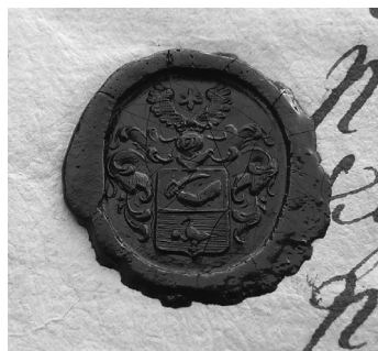
Csíkpálfalvi Bíró Imre viaszpecsétje (1790)