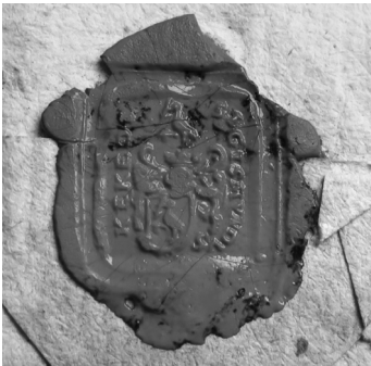
Csíktaplocai Lázár István Kékedi-címeres viaszpecsétje (1766)

A vizsgált csíkszéki pecsétanyagban az osztatlan pajzsú címerék (903) közül