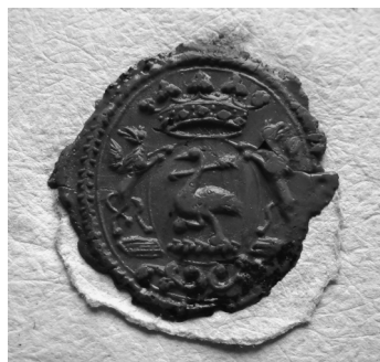
Pókakeresztúri id. Székely Elek viaszpecsétje (1785)