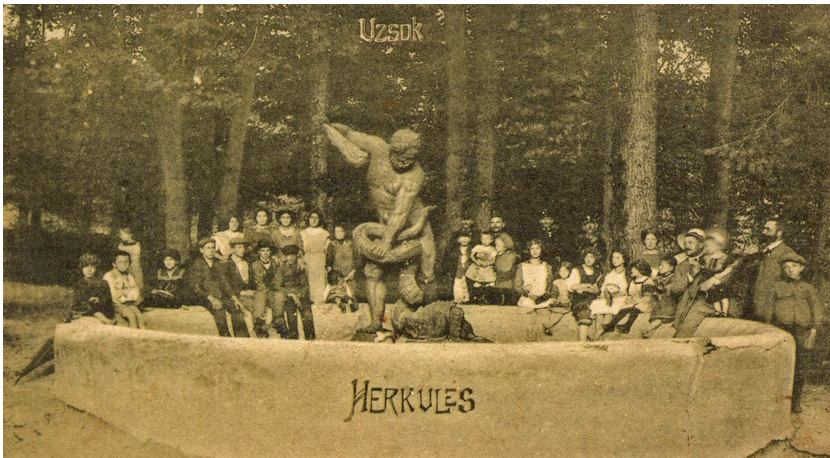
A Herkules-szobor az eredeti helyén

Az Uzsoki-hágóról leereszkedve az első település az ukrán-ruszin Uzsok, lakossága 753 fő. Nevezetessége a falu szélén, a hegyoldalban, festői környezetben álló kis fatemplom, amely az UNESCO kulturális világörökségének a része.