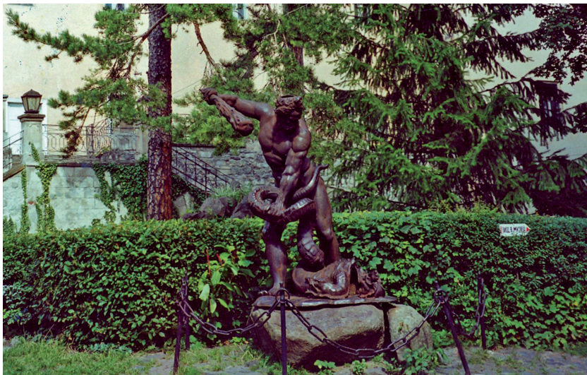
A Herkules-szobor az ungvári várkertben

Van a dolognak azonban két nagyon érdekes pikantériája. Az egyik, hogy Borovszky Samunak a 19. és 20. század fordulóján megjelent vármegegye-monográfia sorozatából ismert, hogy az Uzsoktól nagyjából Turjaremetével megegyező távolságban fekvő, a Ciróka-patak völgy központjának számító Szinnához ( ma Szlovákiában Snina ) tartozó, Roll József által alapított józsefvölgyi vashámorban 1841-ben ugyanilyen Herkules-szobrot öntöttek. Egykor a nagybirtokos kastélyának parkjában a szökőkút fölött 6 ilyen vasból öntött Herkules-szobor állt. Egy még ma is a kastélypark működő szökőkútjában áll.