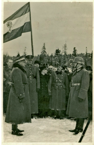
Lengyel-magyar baráti találkozó az Uzsoki-hágón, 1939. 03. 18.