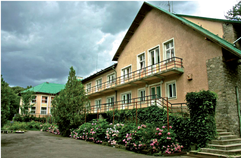
Az egykori Verhovina tábor főépülete

2011-ben az Ungvári Állami Erdőgazdaság és a magyar Országos Erdészeti Egyesület ukrán és magyar erdészek valamint politikai személyiségek részvételével Wagner Károlynak emlékkövet állítottak. Az ókemencei kőbányából származó háromtonnás kötömbön egy 100x60 cm-es, csiszolt bazalttábla két nyelven hirdeti a neves erdész nagyságát. És az az emlékjel talán egy kicsit a nevickei vár környékének egykorvolt gazdag, a magyar történelem szerves részét képező örökség előtt is tiszteleg.