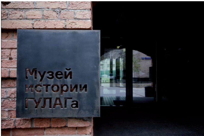
A moszkvai GULÁG Történelmi Múzeum főbejárata.

Kutatástörténelmi szemszögből tanulmányoztuk az emlékezést elősegítő tárgyak, dokumentumok világát. Például a múzeum Halhatatlan barakk 27 nevű online adattárában 1 853 420 politikai elítélt nevével, sorsával ismerkedhetünk meg. 1937–1941 között 463 költőt, író, irodalmárt, bölcészt és újságíró itéltek golyó általi halálra, további 253-at 5-től 25 évig terjedő javító-nevelő kényszer-munkára ítétek, küldtek örökös száműzetésbe, vagy kergettek öngyilkosságba.