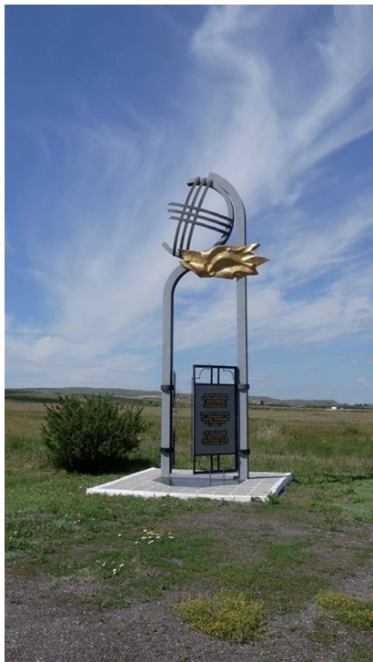
Volt politikai foglyok emlékoszlopa a szpasszki rabtetető bejáratánál

tudjuk, hogy a Szpasszsk területén felállított 99. sz. GUPVI-tábort a foglyok repatriálása után, átszervezés következtében 1948-ban a Karlaghoz csatolták.