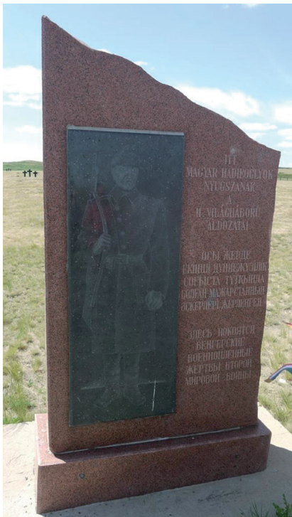
Magyar hadifoglyok és civil internáltak emlékműve a szpasszki emlékparkban