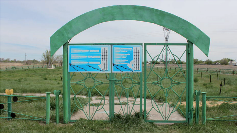
A dolinkai Karlag „Anyácska” temetőjének főbejárata.

csecsemőket végelgyengülésben elhunyt anyjukkal együtt, akik a Karlag foglyai voltak. Legtöbbször szülés közben haltak meg, illetve a későbbiekben éh- és fagyhalál, járványos betegség végzett velük. 10 A rabnőket általában a tábor őrei és a köztörvényes rabok ejtették teherbe. Téli időben a szülészeten elhunyt újszülötteket hordóban tárolták, majd a tavasz folyamán tömegsírba temették.