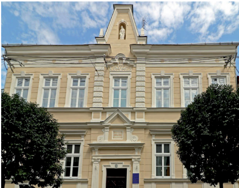
Az egykori Gizellaház, homlokzatán Boldog Gizella kalandos sorsú szobrával.