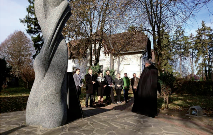
Emlékezés a meghurcolt lelkészekre a beregszászi püspöki hivatal parkjában.