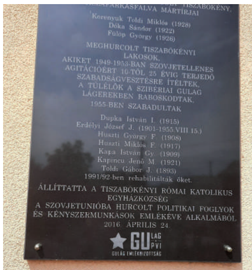
A tiszabökényi GULAG-rabok emléktáblája az Árpád-házi Szent Erzsébet templom falán.

november 9-én szabadult. Három és fél éves elárvult kislánya várta, mert felesége időközben meghalt. Az oroszok két lovát rekvirálták, egy tehénnel, disznóval és terménnyel együtt. Hazaérkezése után még két évig gazdálkodhatott saját földjén, de azt inkább – elmondása szerint – nyomorúságnak lehet nevezni. Rásózták a beadásokat, államkölcsönöket. Tovább nem bírta, 1948-ban kolhozista lett. Visszaemlékezése szerint. „Házról házra jártak, agitáltak, fenyegettek. Sokan mégis inkább másfelé kerestek munkát. Mi a feleségemmel – merthogy 1947-ben újránősültem – maradtunk. A kolhozban kocsis lettem, lóval dolgoztam. Élünk, mint mások...” 20