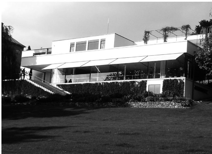
4. kép. A helyreállított épület a kert felől

és elképzelheti, hogy milyen lehetett itt élni. A körülötte már teljesen kiépült lakónegyedben más lett a pozíciója, mint volt, a semlegesnek ható utcai homlokzat távolságtartást és befelé fordulást sugall.