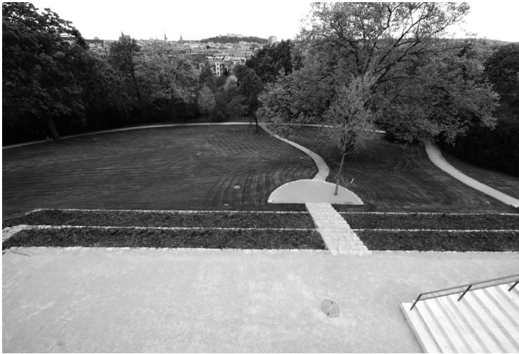
1. kép. Kilátás a városra a nappaliból

Mai szemmel nézve ez az ingatlan értékesebb része, innen rá lehet látni az egész belvárosra, de 1928 körül a Cerná Pole-negyed még csak éppen elkezdett kiépülni, divatossá csak körülbelül egy évtizeddel később vált. Az egyébként inkább zárt karakterű utcai főhomlokzatot is részben a kivételesen szép panoráma határozta meg, ezért is lehet átlátni a lapostetővel összefogott két tömeg között (a kisebb, majdnem az oldalhatáron álló épület a személyzeté volt).