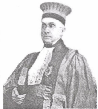
Henri Coquand (1811—1881)