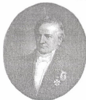
Sulpice François Beudant (1787—1850)

Ki volt Beudant? Már maga az a tény is, hogy 1833-ban a Magyar Tudományos Akadémia tagjai közé választotta, figyelmet érdemel. Életútját és eredményeit A. Lacroix (1931) ismertette. Külső megjelenését a mellékelt metszet (1. ábra) szemlélteti. A kép a Francia Akadémia díszruhájában ábrázolja, mellén a Francia Becsületrend és az Akadémiai Pálmák kitüntetéssel.