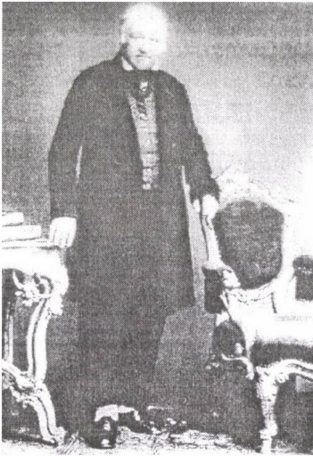
Ami Boué (1789—1881)

2. ábra körü nyelvismerete tett lehetővé. Rendkívül nagyszámú publikációja jelent meg, főként francia és német nyelven. Ezek a kontinens szinte minden országára kiterjedtek. Ez tette lehetővé, hogy 1829-ben elkészíthette Európa első földtani térképét, amit 1843-ban a világ első földtani térképe követett. Az utóbbi térképét Párizsban adták ki.