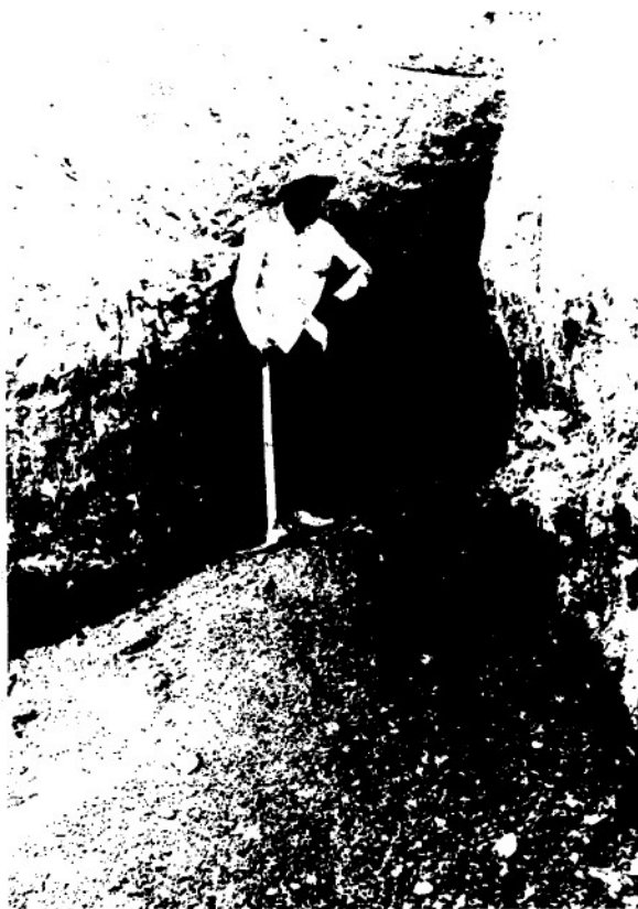
VÁRNAI LÁSZLÓ FOTOGRAFIKÁJA

Egyre kevesebb az ember. Egyre több a zombie. Hullavegetáció. Halhatatlan testek. Ahol lehet, hol nem lehet, piszkítanak, rontanak, hangoztatván a viszonylagosságot, mit korlátolt tudatuktól tesznek függővé. Az embereknek esküdt ellenségei. Akinek arca borzalmas, tükrét összetöri. Öngazolásokat tákolnak. Gondoljunk az eredendő bűnről szóló hamis tanításra, mely hozzájárul a világ folyamatos megromlásához.