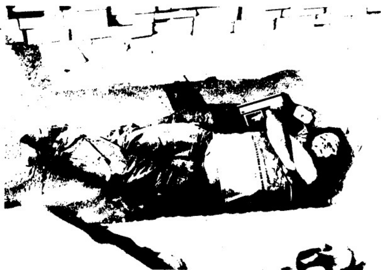
VÁRNAI LÁSZLÓ FOTOGRAFIKÁJA