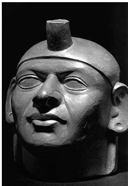
PORTRÉKERÁMIA (ANDOKI CIVILIZÁCIÓ)

Összességében elmondható, hogy az utóbbi évtizedekben a mexikói magyarságkép leszűkülte. Eltűnt belőle például a labdarúgás és az 1956-os forradalom is. Mexikóban, és általában Latin-Amerikában, a magyar jelenlét csökkenő tendenciát mutat – több magyar külképviselet bezárt, Magyarország a rendszerváltás után jószerivel kiszorult a latin-amerikai piacról, a szubkontinensen élő kivándorolt magyarok száma pedig egyre fogyatkozik. Következésképp a jövő nem sok jót sejtet. Egyrészt kevésbé valószínű, hogy a mexikói magyarságkép színesedni fog, például olyan egyébként potenciálisan meglevő elemekkel, mint a magyar zeneszerzők. A nyolcvanas évek évfordulói, 1981-ben volt Bartók Béla, 1982-ben Kodály Zoltán születésének 100. évfordulója, 1986-ban pedig Liszt Ferenc halálának centenáriuma, jó lehetőséget kínáltak a magyar zene mexikói népszerűsítésére, ez azonban már akkor is az anyagiak hiányán bukott el. A közeljövőben a mexikói magyarságkép további elsűrkülése várható, s az, hogy abban egyre nagyobb teret nyernek a régi sztereotip beidegződések; és nem lenne meglepő, ha Magyarország és a magyarság mexikói megítélése romlana.