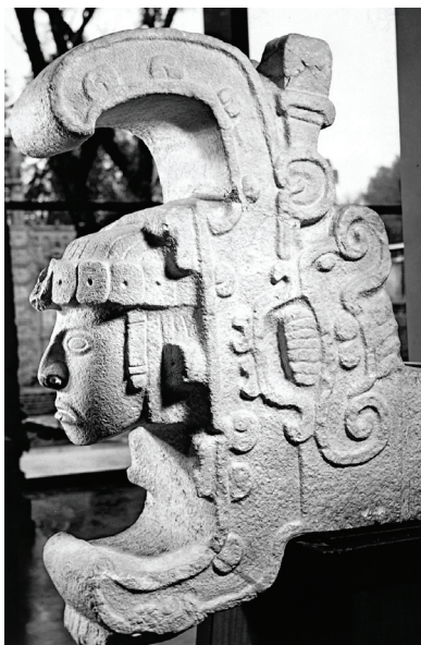
KÍGYÓ (MAJA MŰVÉSZET)

Ahogy a fentiekből kitűnik, világviszonylatban a latin-amerikai film rálépett arra az útra, amelyen eljuthat más országok közönsége elé. Ehhez azonban arra is szükség van, hogy a potenciális befogadó is megnyíljon az újdonság irányába.