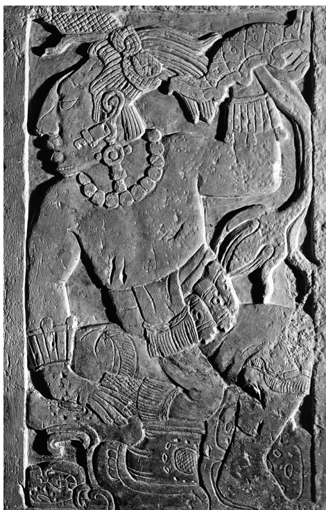
MADRIDI KŐ (MAJA MŰVÉSZET)

Simón Bolívar árnyalt megítélésének, politikai felfogásának, tetteinek értékelésekor tehát a kor Latin-Amerikájának értő ismeretén át juthatunk el, még akkor is, ha természetesen emberi gyarlóságait is számba vesszük.