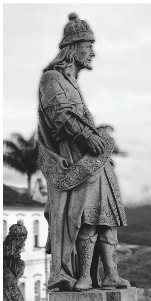
ANTONIO FRANCISCO LISBOA: Hóseás próféta (Brazília)

Has alatt, comb fölött, mint az ágy, amit békén hagyott már rég a vágy, olyan vagy, mint a hajnalok, s hajnal vagyok, ha ott vagyok. Micsoda csend van benned, és micsoda húsos szenvedés. Miféle bűn, miféle reszketés! Folytonos hazaérkezés. Altass el, suttogj, csillapíts. A dédelgetésnek ára nincs. Mit bánom én, hogy női, férfi. Aki akarja, félreérti. Tiltott kanóc, és szikrakő. Dacos faként áll az idő.