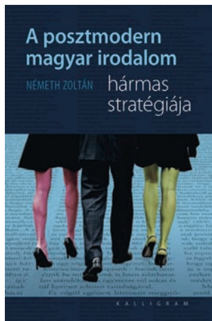
Kalligram Könyvkiadó Pozsony, 2012 134 oldal, 2600 Ft