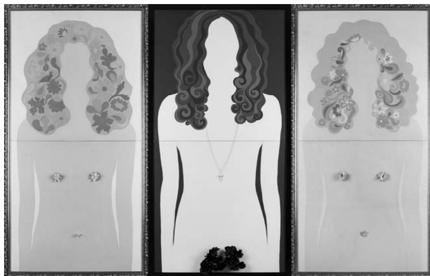
JANA ŽELIBSKÁ: TRIPTICHON, 1969. Slovak National Gallery, Bratislava

Milyen rendezőelv szerint is szerveződnek a más-más fórumra született, mégis egységes gondolati sort kirajzoló írások? Legjellemzőbben talán az irodalom és az életbeli szituációk sajátos váltású dinamikáját, pulzálását, kölcsönhatását említhetnénk: a kötet finom áttételekkel vezet el, majd téríti vissza olvasóját újra és újra az irodalmi szöveghez. Miként az utolsó elemzés emlékezetes nőlakja, Szonyecska (Ulickaja kisregényében) lép el, majd vissza „az olvasás narkotikumához” (209), amely – mint látjuk – még intim közegben megélt formájában is közösségteremtő erővé válhat.