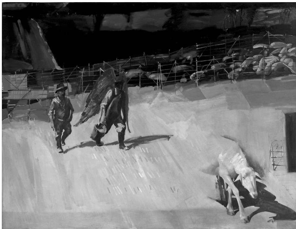
JÓPÁSZTOROK. 2011. OLAJ. FALEMEZ. 152×125CM

S ami a legfontosabb: olvasmányos és üdítő gyűjtemény Deczki Saroltáé. Annak is, aki a jelen irodalmába szeretne kicsit belelátni (meg a közelmúltéba), aki az irodalomtudomány vagy a filozófia újabb terméséről szeretne áttekintést kapni. Nem kell tájékozottnak vagy alaposan felkészültnek lennie – előzékeny és jó vezetőt kap maga mellé.