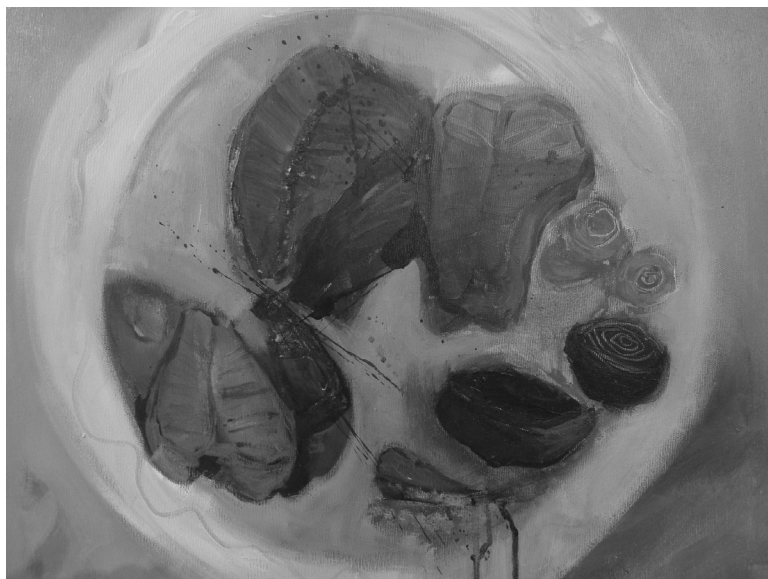
HALSZELETEK, 50×60 CM (AKRIL, VÁSZN) 2014.