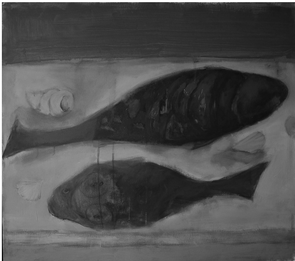
CSENDÉLET KÉT HALLAL ÉS KAGYLÓKKAL, 80×90 CM (AKRIL, VÁSZON) 2016.

megjelentetése. A könyv egészéről pedig elmondható, hogy valóban afféle előszobában (tornácon) toporgás jellemzi: attól, hogy egy latin szó polyszemiája megidézi a poklot, még nem biztos, hogy a bűnről vagy a bűnhődésről tud vagy akar mondani valamit a beszélő (legfeljebb céloz rá), ahogy az sem, hogy akármilyen túlpontos víziókban számol be arról, hogyan érzékelünk egy tájat, egy jelenséget, egy fizikai állapotot, attól még tud vagy akar is arról pontosan nyilatkozni, vagy pontosan arról beszélni, hogy képtelen róla beszélni. Ebbe pedig bizony sokszor belezavarodnak a szövegek – ami a fentebb említett, hosszan kitartott, aprólékos, nyomasztó atmoszférájú leírások, illetve a merész képalkotási technika miatt nagy kár.