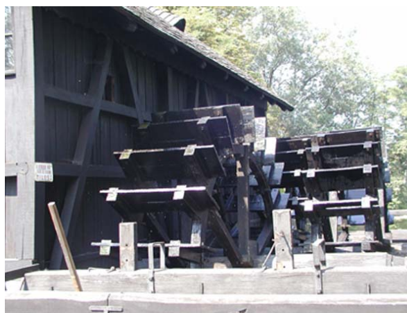
A túristvádi működő vízimalom