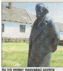
Az író ember nagyságú szobra

Tiszacsécsén áthaladva megtekintettük a gondozott, szalmával fedett Mórincz Emlékházat. (A közhiedelemmel ellentétben Mórincz Zsigmond nem ebben a házban született.) Az udvar közepén áll a Mórinczot ábrázoló, 1979-ben felavatott egész alakos bronzszobor, Varga Imre alkotása.