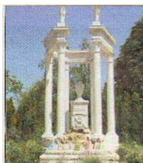
Kőlcsey Ferenc temetői síremléke

művészeti alkotásokkal gyarapodott. A famennyezetet virágmintás kazetták díszítik. Ezek az értékek az Országos Műemlékvédelmi Hivatal által 1992-97 között végzett restaurálási munkák eredményeként láthatók ma. A helyreállítást 1998-ban Európa Nostra díjjal ismerték el. Alapos szemlélődés és gyönyörködés után indultunk tovább.