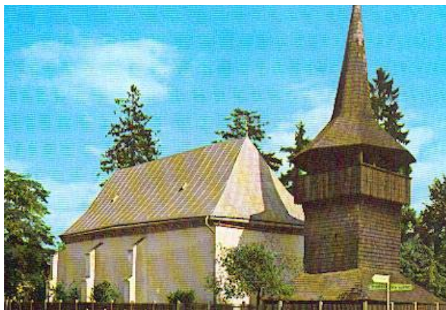
A kölcsei református templom

Kölcse története a honfoglalás koráig nyúlik vissza. A Kölcsey család ősi fészke volt, neve feltehetőleg török eredetű. Az egyhajós