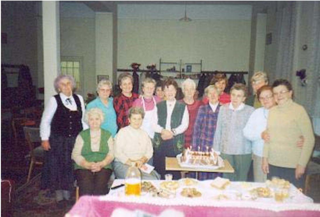
A tíz szál gyertyás torta volt a szeretetvendégség utolsó fogása