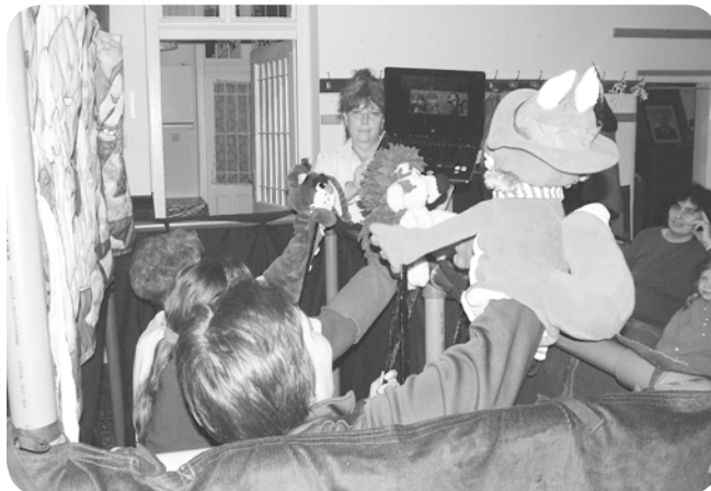
A paraván mögött

A csoport naplójából a következők derülnek ki: A csoport megalakulása szeptemberi megalakulása óta nyolc különböző helyen, 598 főnek (gyermekek és idősek) adtuk elő a báb-műsort. Természetesen, előzetes megbeszélés után, teljesen ingyen megyünk minden alkalomra, hiszen mi ezt misszió-nak tekintjük a szónak abban az értelmében, hogy minél több gyermeknek szeretnénk elvinni a szeretet üzenetét. Mivel