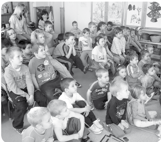
Amiért érdemes csinálni: a figyelmes és hálás közönség