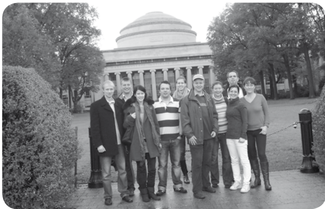
Magyar diákok az MIT előtt

A bemutatott módszer egy csapatverseny: a hallgatók egy évig dolgoznak a szintetikus biológia területén, majd egy dzsemborin bemutatják eredményeiket. Akkor keveset tudtam arról, hogy mi a szintetikus biológia, a dzsemboriról pedig csak a cserkész találkozók jutottak eszembe, ám a bemutatott eredmények magukért beszéltek: a bakteriális számítógép és a fényérzékeny baktériumok annyira újszerűek voltak, hogy biztos voltam benne: egy ilyen programba érdemes belevágni.