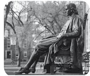
John Harvard szobra

vemberben, az indulás előtt kértem a pénteki bibliaórán, hogy áldással tudjunk útnak indulni a megméretetésre. Egy évnyi tervezés, előkészítés és megfeszített munka, számtalan előre nem látott akadály és előre nem várt segítség után is világos volt, hogy minden erőfeszítés szertefoszlik egy lekésett repülő, egy hirtelen betegség vagy baleset után. Egy tizenhat emberes csapatnál ezeknek a valószínűsége pedig legalább tizenhat-szoros!