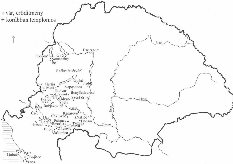
JOHANNITA PRECEPTORIUMOK A 14. SZÁZADBAN