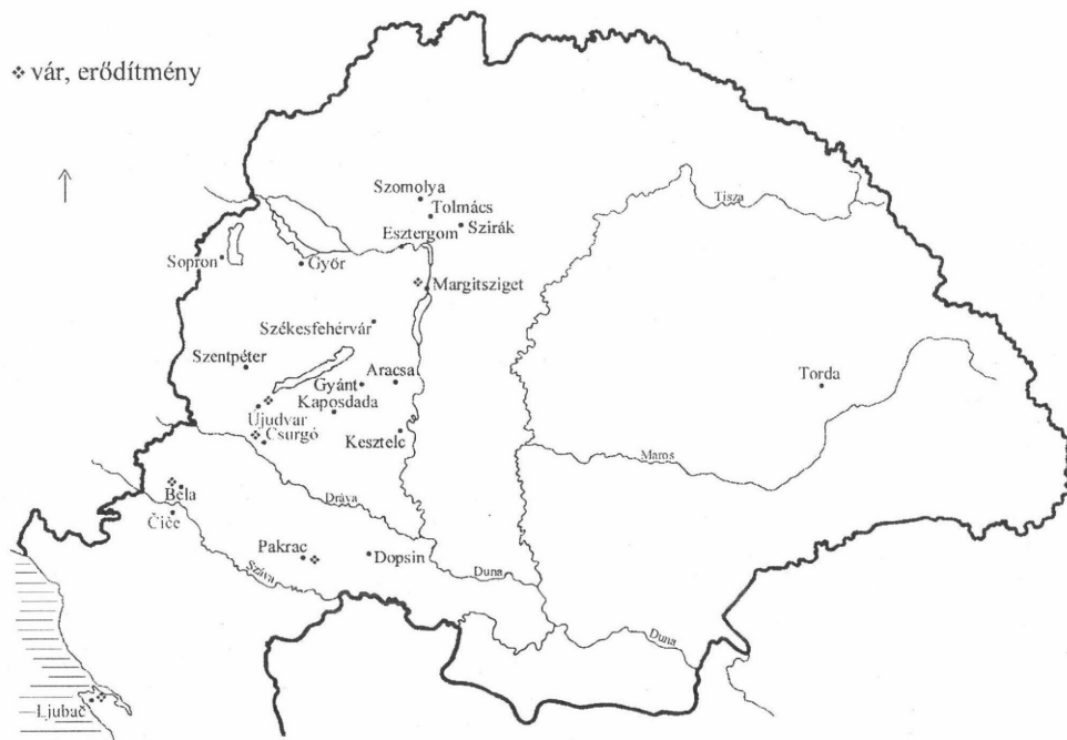
JOHANNITA PRECEPTORIUMOK AZ ÁRPÁD-KORBAN

önálló házként szereplő Kesztelec, 52 valamint az 1226-ban hasonló státuszú Aracs 53 minden bizonnyal a tolnai főesperesség területén feküdt. Elsősorban az uralkodói támogatásnak, illetve a kisszámú magánadománynak köszönhetően a 13. század első felében már tucatnyi egységről vagy annak részéről tesznek említést a források, amelyekről nem tudjuk pontosan, hogy hány preceptorium ot alkottak: Fehérváron kívül Lubán (Ljubač), Kesztelcen, Csurgón, Szirákon, Aracsán, Esztergomban (Szent Kereszt patrocíniummal), Újudvaron, Tolmácson, Dadán (Kaposdada), Sopronban és talán Győrött is voltak tartozékai ( domus, camerae, membra ) a rendnek.