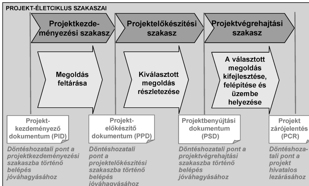
1. ábra – A projektek életciklusának szakaszai

23. A projektek eredményes ellenőrzését a POCP-dokumentum azzal segíti elő, hogy a projektek életciklusát logikai szakaszokra osztja fel, és pontosan kijelöli a döntéshozatali pontokat (lásd: 1. ábra ). A POCP összehasonlítása a PMBOK-val azt mutatta ki, hogy a POCP nagyrészt összhangban volt a PMBOK képviselte követendő gyakorlattal. A POCP a következő két területen volna javítható: az érdekelt felek elemzése, valamint a projekt hatásának utólagos értékelése. A következő bekezdések részletesen bemutatják a jelenlegi hiányosságokat és azok hatását.