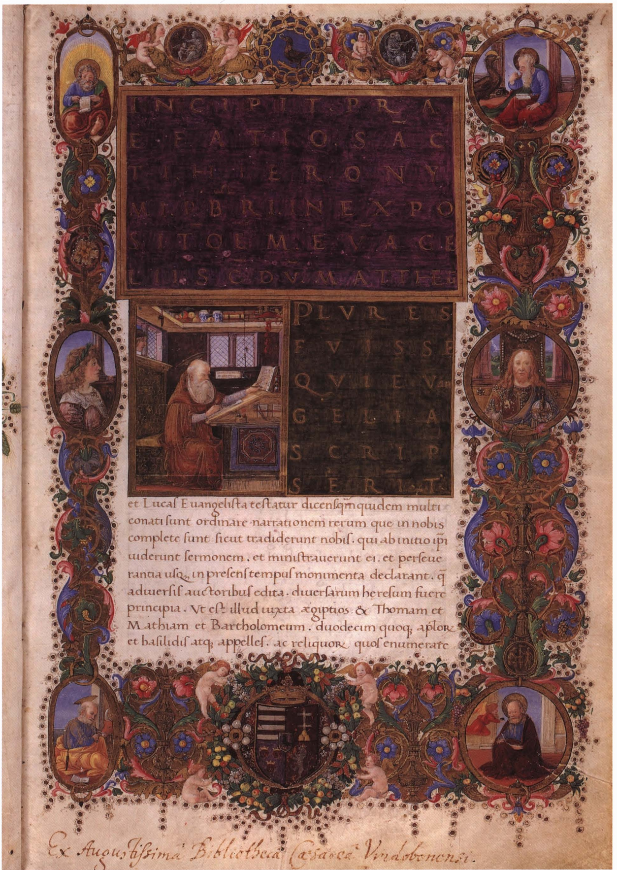
S. HIERONYMUS: EXPOSITIO EVANGELII, 1488, Pergamen; 355×240 mm Österreichische Nationalbibliothek, Cod. 930. f. 1r