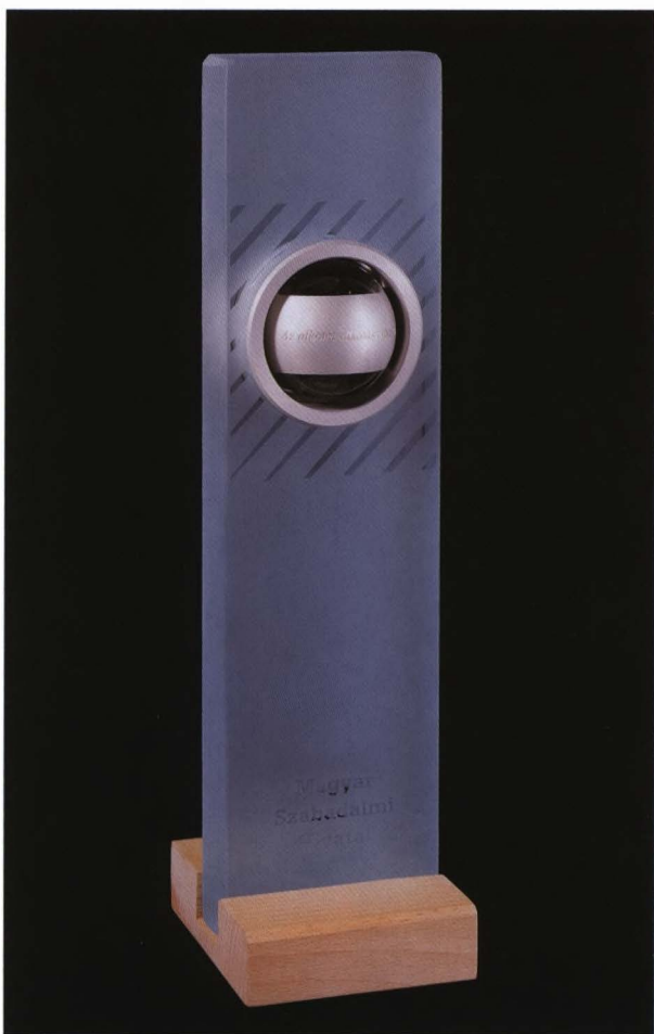
A Szellemi Tulajdon Világnapján a Magyar Szabadalmi Hivataltól a szellemi tulajdon hatékony védelméért kapott díj

Nemzeti értékeinkkel, kulturális javainkkal példásan bánó tevékenységéért könyvtárunk tavaly a Millenniumi Díjban részesült. Az elismerő címet a Szellemi Tulajdon Világnapján a Magyar Szabadalmi Hivatal adta át az Országos Széchényi Könyvtárnak.