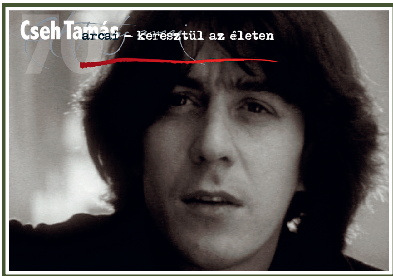
Az egynapos bemutató plakátja

A program nem csupán Cseh Tamás életművének, pályájának, alkotásainak bemutatója volt, de egy nap-