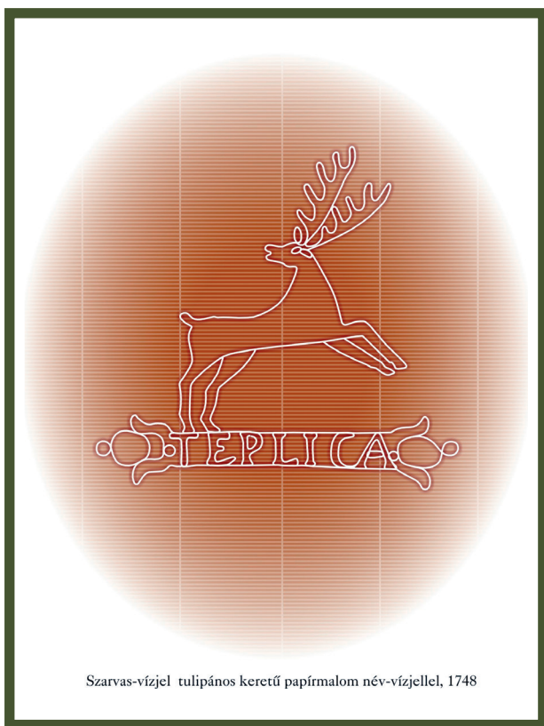
Szarvas-vízjel tulipános keretű papírmalom név-vízjellel, 1748

A tárlókban tematikus csoportokban elhelyezett, eredeti papíralapú emlékeket, merített papírra készült kalendáriumokat, díszes kötésű könyveket,