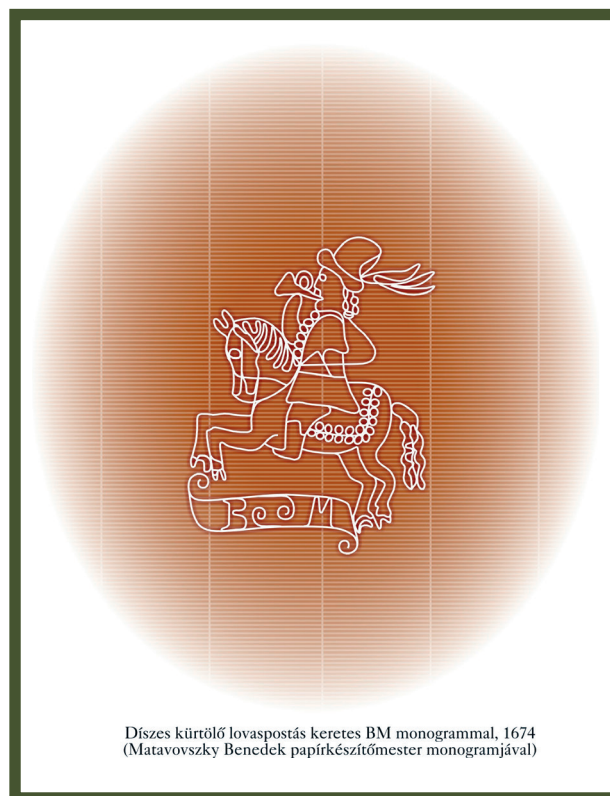
Díszes kürtölő lovaspostás keretes BM monogrammal, 1674 (Matavovszky Benedek papírkészítőmester monogramjával)

A teplici nagymúltú papírkészítésnek az egyetemes és magyar papírtörténetben, valamint nemzeti kultúráinkban betöltött jelentős szerepe előtt tisztelegve a Magyar Papír- és Vízjeltörténeti Társaság a jubileumi 2013-as évet TEPLIC emlékévként nyilvánította. Ebből az alkalomból az OSZK ereklyetéri kiállítással egyidőben kiadásra került a papírmalom történetét