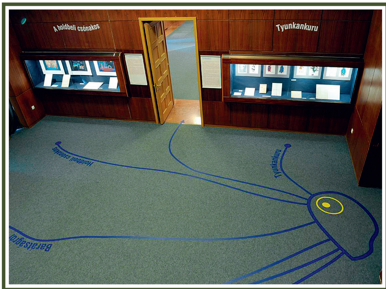
Az első terem

megőrizte, a dedikált köteteket, a leveleket éppúgy, mint Weöresnek egy-egy ügyetlen vagy éppen ügyes, de mindenképpen sajátos rajzát. Ennek a rendkívül gazdag anyagnak meglelte szinte követelte, hogy a Széchenyi Könyvtár az évfordulón ezt a barátságot mutassa meg központi kiállításán, mint Weöres életének egy kevésbé vizsgált szegmensét. A kiállítást 2013. szeptember 17-én Tolnai Ottó nyitotta meg, aki a kortárs költők közül a legérzékenyebben mozog, szakértőként is, a képzőművészet terén, és mindkét alkotó munkáit behatóan ismeri, Illés Árpád műtermét már évtizedekkel ezelőtt felkereste.