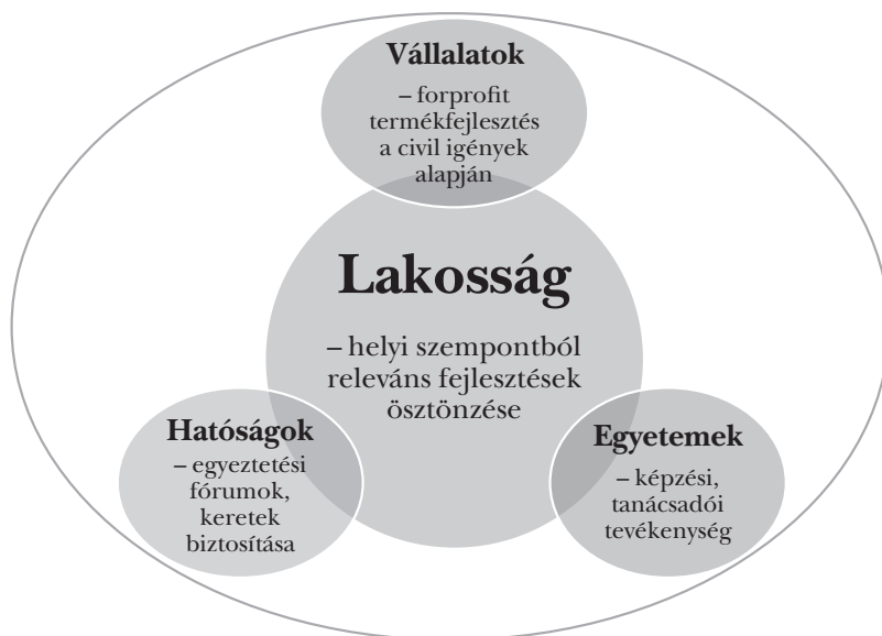
2. ábra: A helyi gazdaságfejlesztés civil központú Quadruple Helix-modellje