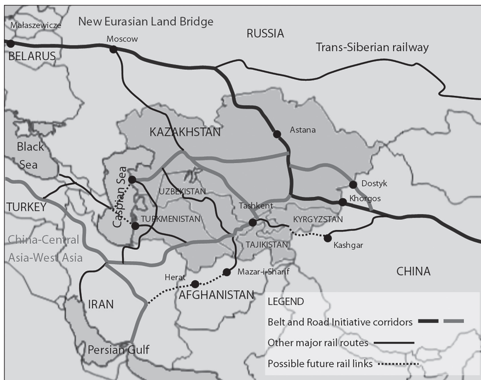
4. ábra: Közép-Ázsia közlekedési hálózata az Övezet és Út Kezdeményezés kontextusában