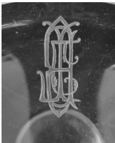
Forrás: Hevesy Anna ajándéka, fotó: Zemen Pálné