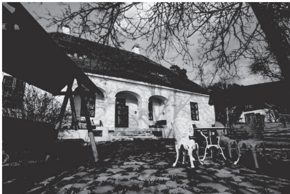
3. ábra: A kúriák földje – Háromszék