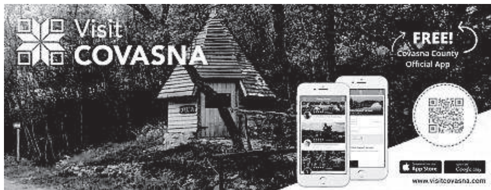
5. ábra: Visit Covasna applikáció – online reklámbanner