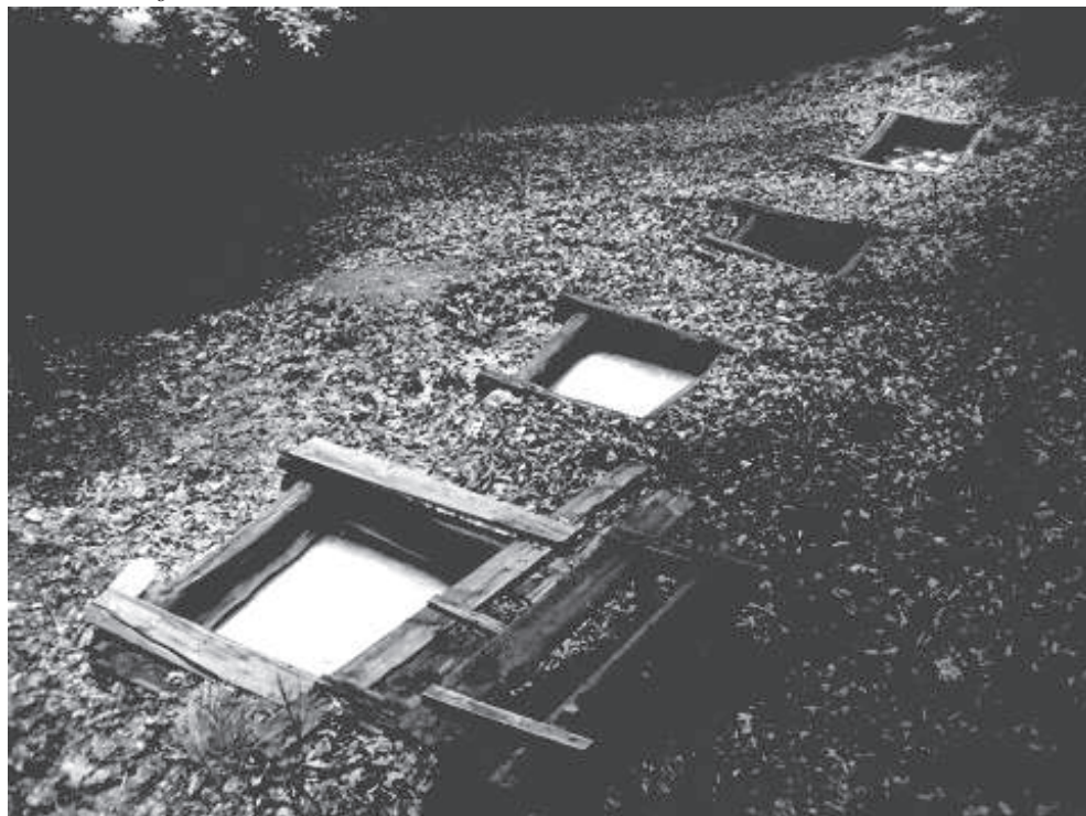
4. ábra: Borvízforrások Háromszéken