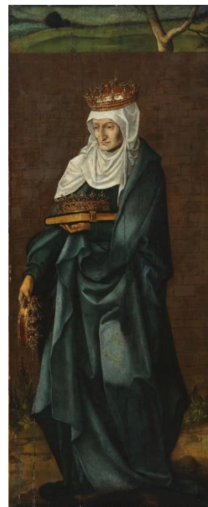
10. kép: Németalföldi festő, 1520 körül: Magyarországi Szent Erzsébet