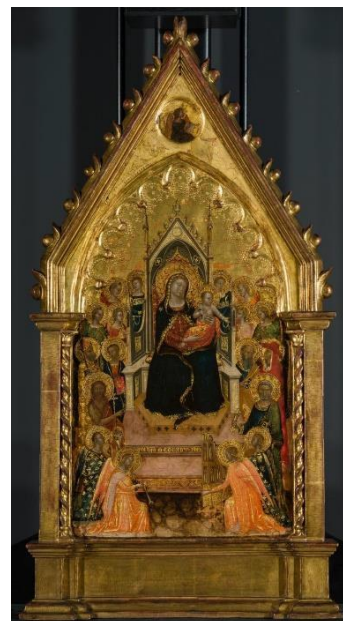
6. kép: Giusto de' Meabui (1320/1330 körül–1391 előtt): Trónoló Mária gyermekével