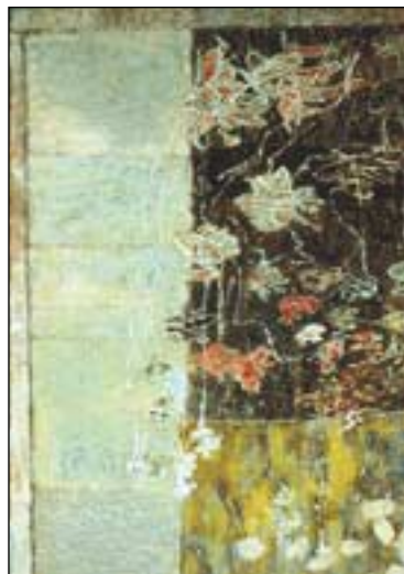
Rózsakert zöld háttérrel (1981)

Gedő Ilka (1921-1985) a közelmúlt magyar művészetének egyik legizgalmasabb alakja. Egyéni, szuverén, nemzetközileg elismert művészete, alkotásainak egyedülálló, finom színvilága a felfedezés erejével hat a szemlélőre. Művészete sokrétű és sokirányú. Rajzai, grafikai sajátos világot idéznek az önbrázolás sokoldalúságától a gettó világának rettetéséig. Fordította Goethe színtanát és erre alapítva építette fel finom, érzékeny színvilágát. „Gedő Ilka a huszadik századi magyar művészet egyik legjelentősebb, egyben legkevésbé ismert művésze. Bár fiatal kora óta szoros kapcsolata volt kortárs képzőművészekkel,