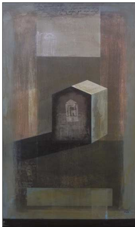
Nádas Alexandra: Provence-i emlék

más és más kontextusban bontogatta ezeket sokak számára hétköznapiak tűnő, de - mint az a művekből kiderül - gyakran retentő mélységeket adó motívumokat. Később gúzsba kötött bábok ülnek a ladikokban, kietlen tópartokon súlyos misztériumokról mesélve. A szemlélődő