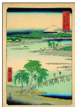
Utagawa Hiroshige Az Oi-kawa folyó Suruga és Totomi tartományok közt

A japán fővárostól, Tokyo-tól délnyugatra található Fuji az ország legmagasabb hegysúcsa (3776m), melyet még mindig aktív vulkánként tekintenek. Japánban a Fuji hegyet régtől fogva kultikus tisztelet övezi, zarándokok keresik fel. Tökéletesnek tartott formája Japán jelképeként világszerte közzismert.