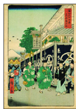
Utagawa Hiroshige A Suruga-cho negyed Edoban

A kiállítás november 13-ig tekinthető meg.