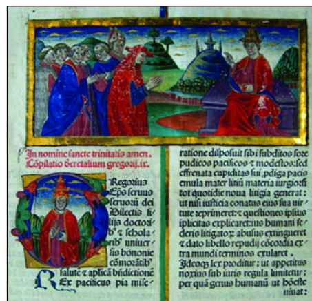
IX. Gergely pápa Iniciálé. Decretales, Venetia, 1479. (45 x 42 mm)