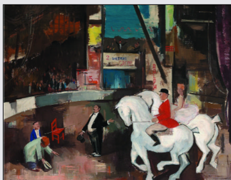
Aba Novák Vilmos: Cirkusz

már találkozhatott. Más darabok a művészettörténeti szakkönyvekből, a bank különböző helységeiből ismerősek, de vannak persze olyanok is, amelyek most kerültek először a széles nyilvánosság elé. A képzőművészeti gyűjtemény első darabjai másfél évtizeddel ezelőtt kerültek a bank tulajdonába. Megvásárlásuk célja nem az értékfelhalmozás, hanem az értékmentés volt, ugyanis azokban az években számos jelentős művészeti alkotás került be a műkereskedelmi forgalomba. Helyes cselekedetnek tűnt, hogy ezeket egy olyan intézmény vásárolja meg, amely gondoskodni akar és tud e közkinccsek megőrzéséről és láthatóvá tételéről, akár olyan módon is, hogy azokat tartós letétként a Magyar Nemzeti Galéria rendelkezésére bocsátja, vagy hozzájárul ahhoz, hogy különböző időszaki kiállításokon mutassák be egyes darabjait. Az MKB Bank a klasszikus értékek mellett a kortárs képzőművészet felé is különös figyelemmel