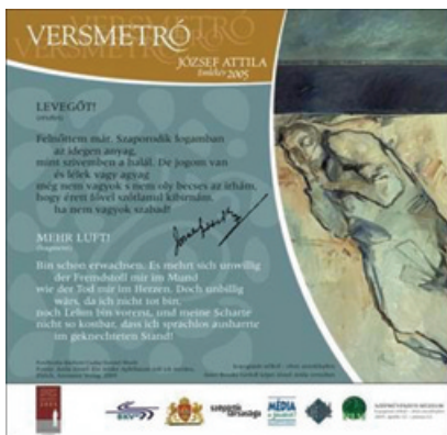
Az év elején József Attilával utaztunk

szereetnek, amire valamilyen személyes, titkos viszony miatt szeretettel gondolnak.