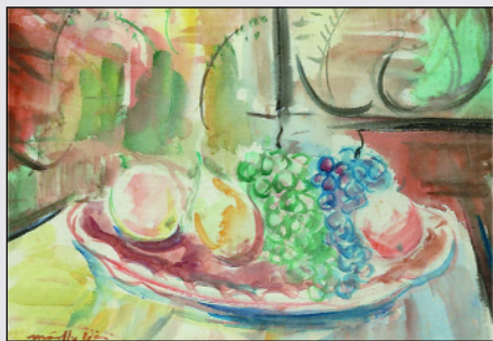
Márffy Ödön Csendélet Gyümölcsökkel

Az MKB Bank gyűjteményének kiállítása egyedi és művészeti szempontból is ritkaság értékű. A magyar bankok és pénzintézetek közül az MKB Bank kezdte el legrégebben műalkotások vásárlását. A mintegy másfél évtized alatt létrehozott gyűjtemény a XIX. és XX. századi magyar művészet történetéből ad exkluzív válogatást, amelyet néhány jeles kortárs alkotó munkája egészít ki. A gyűjtemény számos darabja vagy az adott kor egy-egy művészeti irányzatának reprezentáns képviselője, vagy alkotójának főműve, illetve az életműben kuriózumnak számító alkotása. A kollekció –művészettörténeti koncepció alapján összeválogatva és megrendezve – most először kerül bemutatásra egy olyan