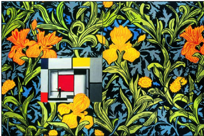
Matisse egy nőről beszél 2001. olaj, vászon 150x200 cm

1976–1980 között, a Rózsa–presszó körének tagjaként kezdte képzőművészeti tevékenységét. Korai művei közül kiemelkednek a portré és az önarckép műfaját kitágító szerep- és nyelvjátékokra utaló fekete–fehér fotói (Önarckép /nő/, 1977; Én ézegek, 1975) és több szekvenciából álló, fekete–fehér kép-