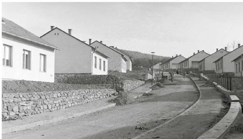
2. kép. Lakótelep a Görgey utcában. Ózd-Farkaslyuk, 1962.