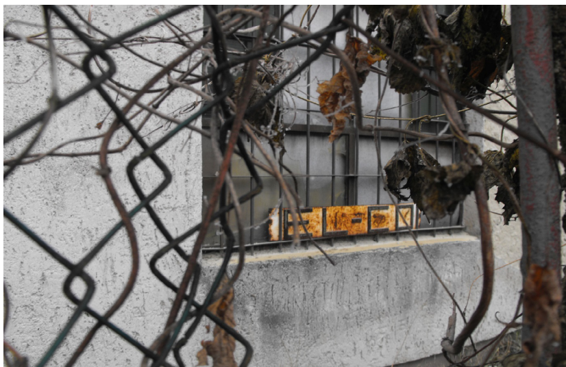
3. kép. Az elmaradt újraiparosítás egyik „rozsdalenyomata”: az El-Co Elektrotechnikai Zrt. Farkaslyuk, 2011.