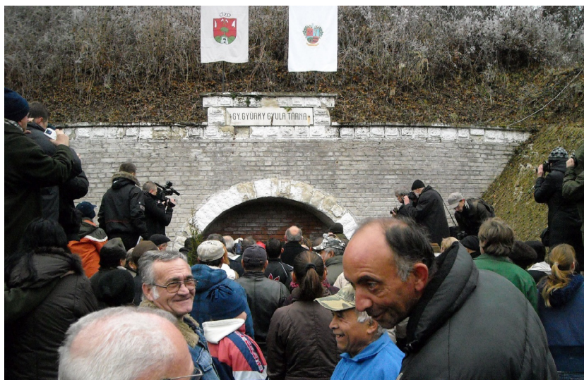
5. kép. Bányanyitásra várva... Farkaslyuk, 2011.

A több szempontból is megközelíthető társadalmi dezintegráció – mint fentebb láthattuk – összetett folyamatok eredménye. Az ezeket illusztráló válságjelenségek halmozódását mintegy keretbe foglaló szegénység az élet minden területére kihat, egyben számos más, együttesen jelentkező szociális és kulturális problémakör okozója, illetve alkotóeleme. A dicső bányász megbecsült státuszának eltűnésével tapasztalható identitásvesztés a társadalmi hovatartozás érzésében is törést okozott. Mindezek hátterében azok a politikai és gazdasági folyamatok állnak, amelyek a térség elmaradottságát tekintve nem kínálnak biztos egzisztenciát és jövőképet, a kollektív emlékezet számára pedig az értékeket hordozó múlttal éles kontrasztot alkotnak.