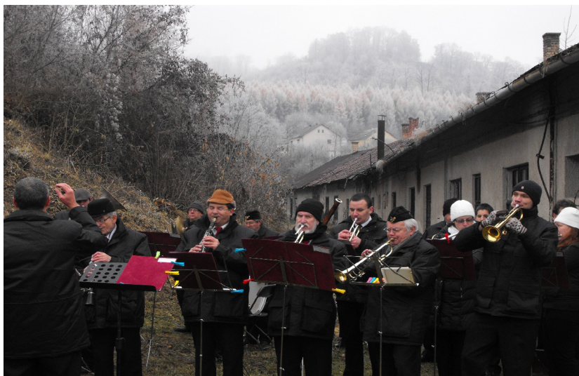
4. kép. Fúvószenekar a bányá remélt újranyitásának ünnepségén. Farkaslyuk, 2011.