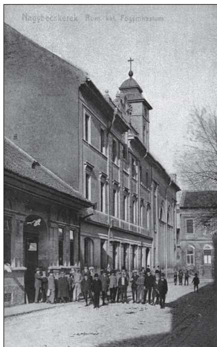
Nagybecskerek, Római-katolikus Főgymnázium