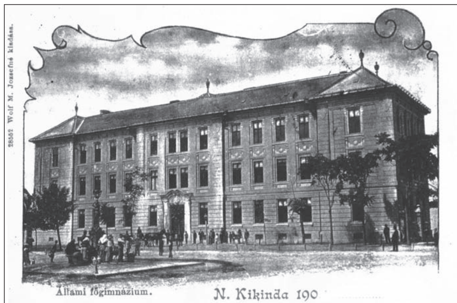
Kikinda, Állami főgimnázium

tották számon. Miután középiskolai tanári és bölcsészdoktori diplomát szerzett, azzal rugaszkodott el a déli végekre az 1880-as években. 1888 és 1890 között tanári vizsgát tett esztétikából, történelemből, latin és német nyelvből, valamint tornatanításból (SZINNYEI 1891–1914: elektronikus változat). Nyugtalan természetére utal, s egyben vállalkozó kedvét és sokféle érdeklődését példázza, hogy 1882 és 1887 között gyalog bejárta Felső-Magyarországot, Erdélyt és az Alföldet; 1887-től kezdődően többször is beutazta Ausztriát, 1893-ban pedig Olaszországot és Svájcot (uo.).