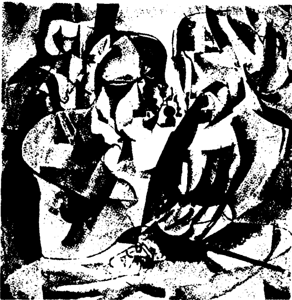
A sakkozó portréja (1911)

In seiner Arbeit zeigt der Verfasser drei Heiratsverträge aus dem Archivsbestand des Bács—Bodroger Verwaltungsgebiete im Sremski Karlovci. Diese Akten sind in der zweiten Hälfte des XVIII und Anfang des XIX Jahrhunderts entstanden und sind in Hinsicht der rechtlichen und nationalen Aspekte der Ungaren relevant. Die Arbeit gibt eine kurze Übersicht über die Problematik in der Fachliteratur und untersucht die rechtliche Praxis, die aus diesem Verträgen zu sehen sind. Durch die Analyse der Texte kommt man zur Feststellung dass zufällig jeder von diesen Verträgen, eine der möglichen Varianten solcher Verträge vertritt. Die Praxis der Bindungen dieser Verträge hängt mit einer Zeremonie der Heiratsgewohnheiten der Ungarn und der Südslawen zusammen, und entwickelt die Hypothese der Gemeinsamkeit der Rechtselemente und die Gewohnheiten bei dem Heiraten. Laut dieser Hypothese, verbunden mit der Sinkretismus der Elemente der Rechtsgewohnheiten, kann man den Weg feststellen der von dem „Ius primae noctis“, durch die Gewohnheiten bis zu dem Heiratsverträgen führt. Da es sich um diachronialen Aufstellung handelt, die sich als Rechtsgewohnheit tretiert werden kann, zeigt der Verfasser auf die Nötigkeit weiterer Untersuchungen in den Archiven hin, im Interesse weiterer Akten des selben Inhalts.